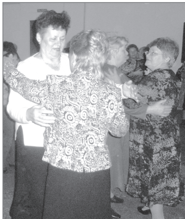
И снова – вальс

Наша редакция приготовила свой подарок! В фойе школы искусств можно будет подписаться на газету «Березовский рабочий» по старой цене – 240 рублей.