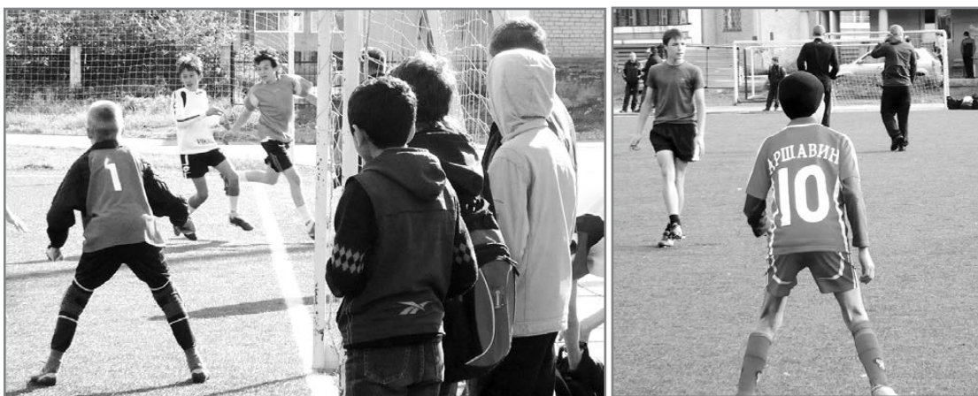
Острый момент у ворот