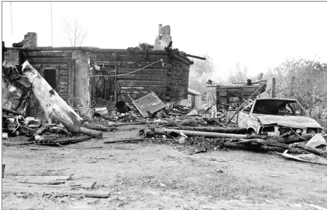
На пепелище дома №25 на Калинина