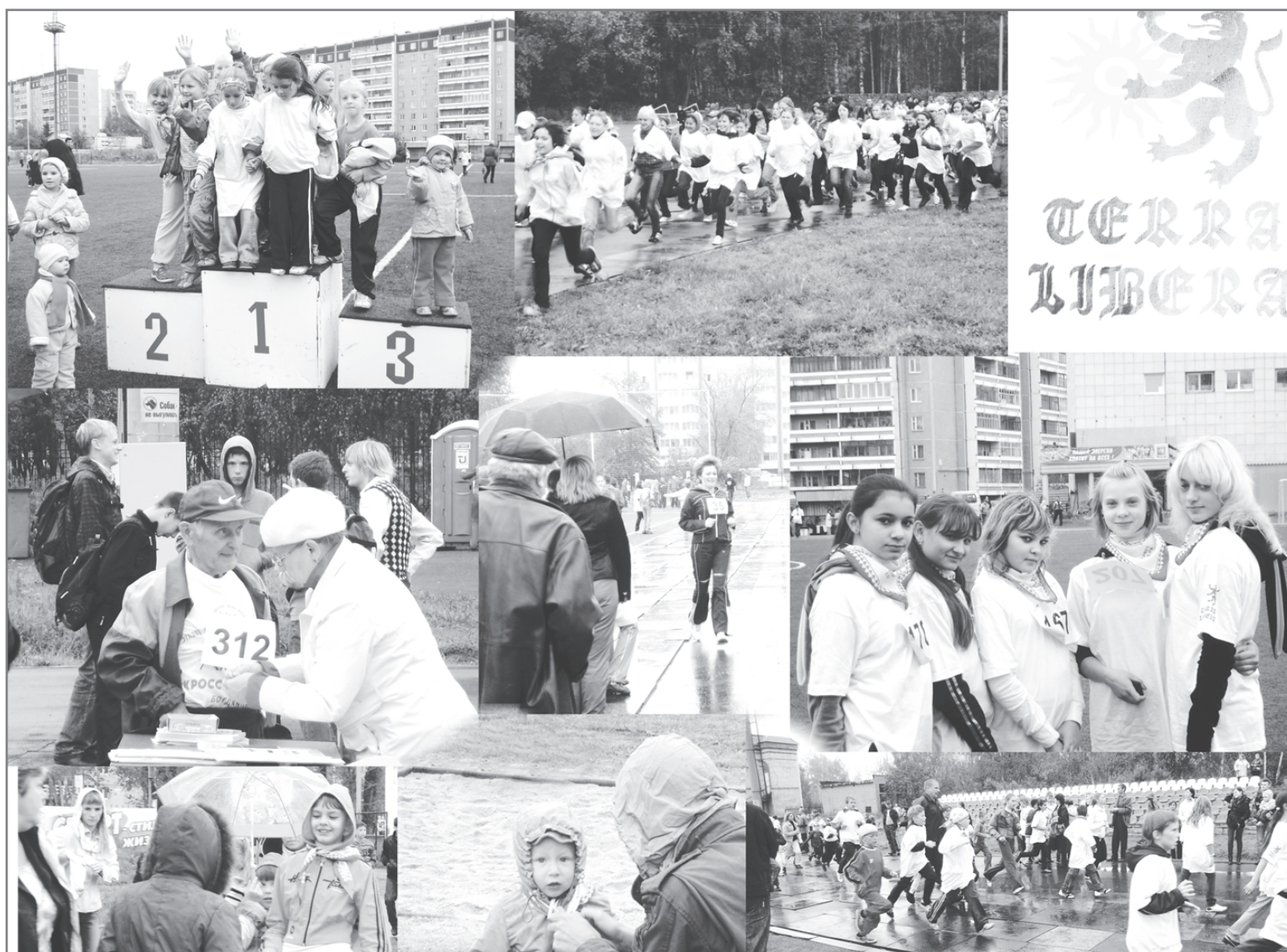
Коллаж Павла КАДОЧНИКОВА