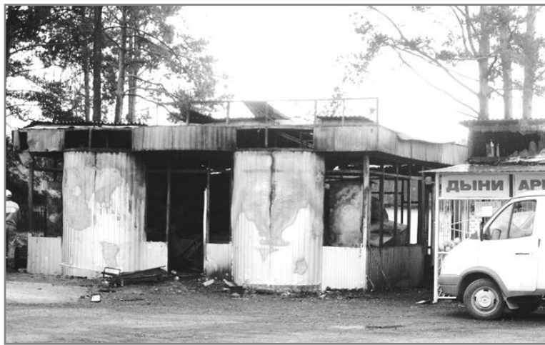
Кафе восстановлению не подлежит