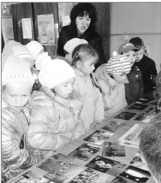
Руководители театра-студии «Дебют» устроили фотовыставку

Допоздна «Современник» принимал гостей: в вечерней программе открытия нового сезона выступили коллективы дома культуры.