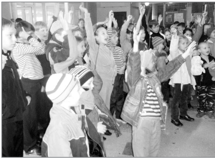
— Кто хочет ходить в «Современник»? — Я!