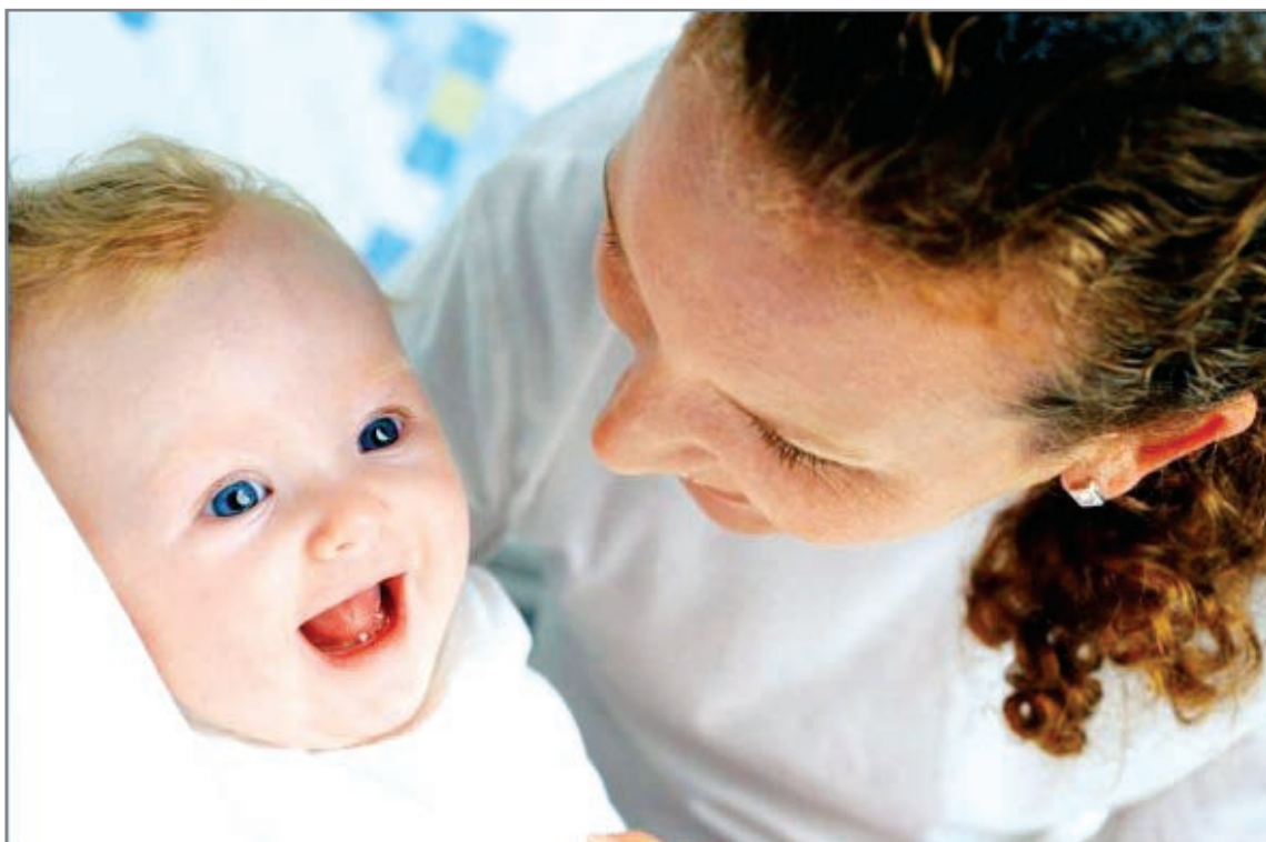
Какая радость – первый зуб!