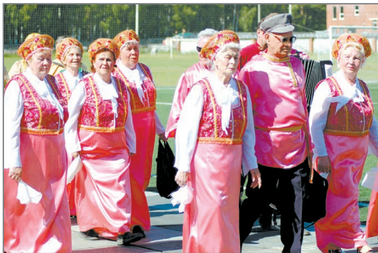
Ветераны по жизни шагают с песней

Справки по телефону: 3-73-33, 8-961-766-46-04.