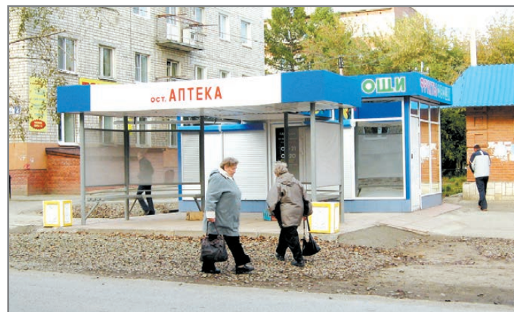
Ждали на «Гортопе» – появилась на улице Мира

Будем надеяться, что остановки в городе меняют не в последний раз.