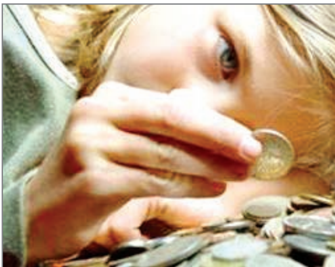
Счастье – в деньгах?

– не стоит бесконечно обсуждать при ребенке нехватку денег в семье. Такие разговоры вселяют тревогу, а особо впечатлительные дети могут начать воровать, чтобы «откладывать» деньги на черный день».