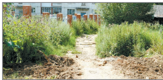
Таким переулочек был прежде

и ответственных людей. Если не помогли в одном деле, то поддерживали обязательно в другом. Вот и в случае нашего маленького переулочка: отказали чиновники, откликнулись журналисты и депутаты. Спасибо все, кто любит свой город!