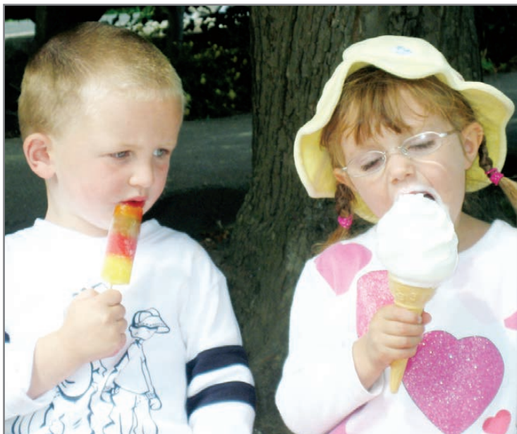
А у тебя мороженка вкуснее...

Индивидуальная непереносимость молока – как поступить родителям в этой ситуации? Нужно внимательнее следить за рационом ребенка. Потребность организма в белке и витаминах В могут обеспечить мясо, бобовые и продукты из муки грубого помола. А вот с кальцием сложнее. В отношении детей, не переносящих молочный сахар, можно переключиться на такие молочные продукты, как йогурт и сыр, – тогда проблема с кальцием считается решенной. Иначе обстоит дело, если ребенок реагирует на молочный белок и не переносит никакие молочные продукты. Тогда нужно искать альтернативу кальцию в растительных молочных продуктах. Например, богаты кальцием различные виды капусты, лук-порей и фенхель. Добавочное поступление кальция может обеспечить такой продукт, как минеральная вода. На этикетке должно быть указано, что кальций в данной воде содержится 150 мг/л.