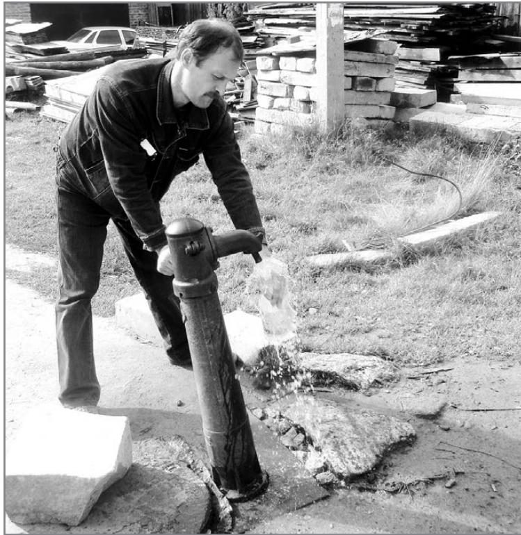
Вода в Ключевске вкуснее, чем в городе