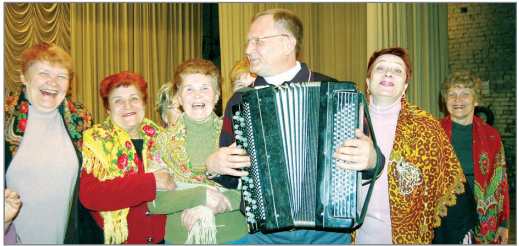
И лётся песня!

Досуговый центр поселка Монетного ждет всех желающих 19 сентября в 12 часов на День открытых дверей. Вход свободный.