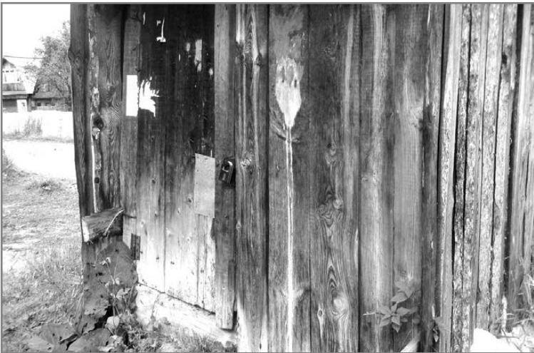
Закрыта колонка от неплательщиков