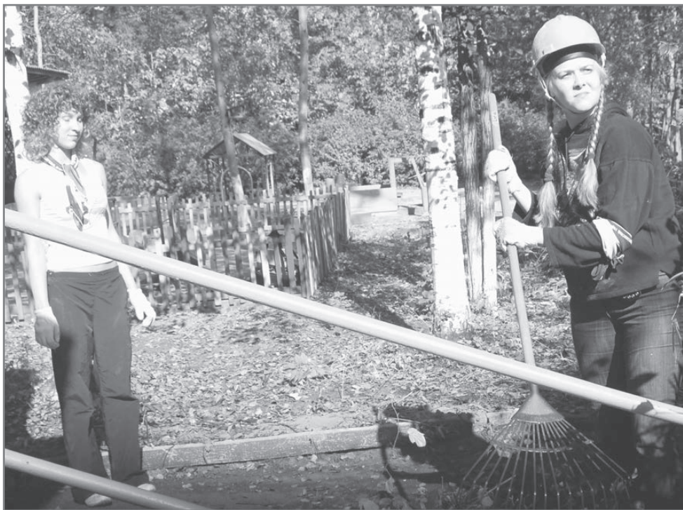
Они хотят пройти путь от малых побед к большим свершениям

Школа бизнеса — проект долгосрочный, и он не закроется через год. Во всяком случае, такие планы на него имеют в администра-