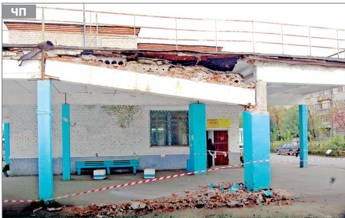
Автостанция сопротивляется продаже?

В Березовском с 11 до 14.30 будет прекращено движение транспорта по улицам Смирнова от ДК «Современник» до Горького; по Горького от Смирнова до Энергостроителей; по Энергостроителей от Горького до Академика Королева; по Королева от Энергостроителей до ДК «Современник».