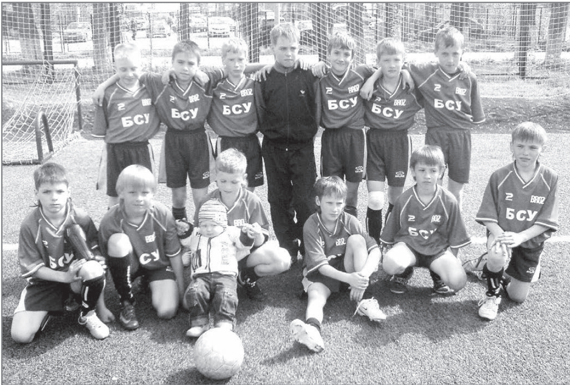
Мы – настоящая команда!