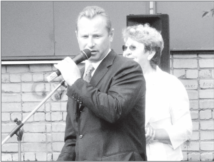
Для детей у мэра всегда есть время

В награду победителям в возрастных группах кроме позитивного настроения и добрых эмоций будут медали и грамоты отдела по физической культуре и спорту Березовского городского округа. Самых старших мужчин и женщин наградают памятными подарками. Самые юные получают мягкие игрушки. Будем надеяться на ясную погоду, будем держать улыбки и хорошее настроение, что свойственно terra libera.