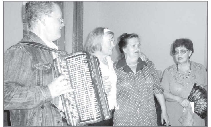
А у баяниста песня льется чисто