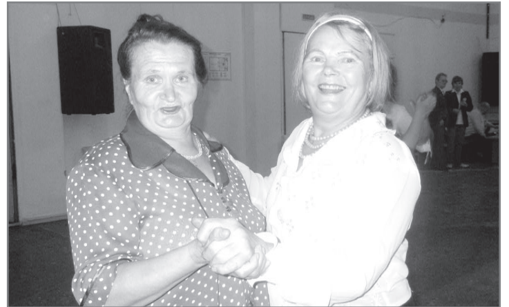
С подружкой на пару

26 сентября в актовом зале КДЦ состоится танцевальный вечер совместно с городским хором ветеранов, посвященный Дню пожилого человека. Организаторы обещают конкурсы, песни под баян, будет работать кафе. Приходите!