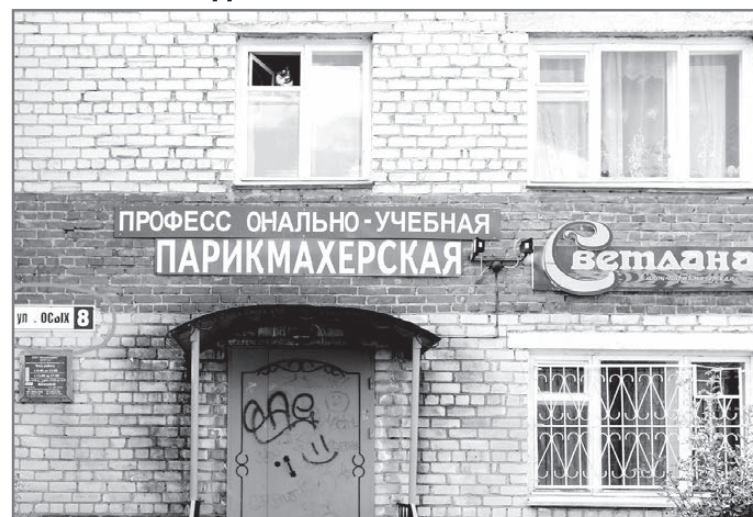
Как слышим, так и пишем?