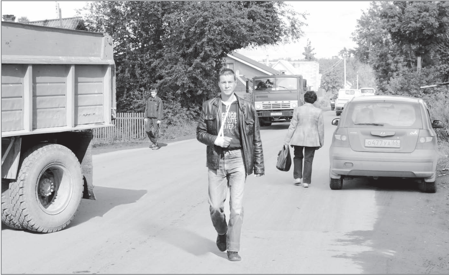
Без хорошей реакции здесь лучше не ходить...