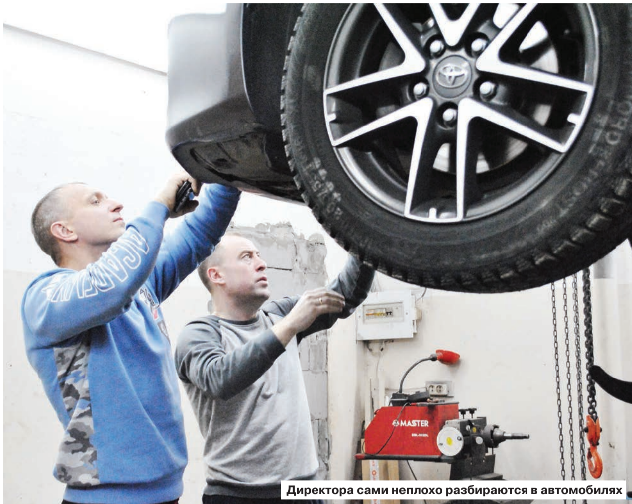
Директора сами неплохо разбираются в автомобилях