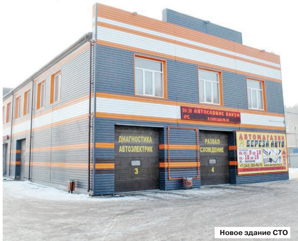
Новое здание СТО

Выглядело же оно десять лет назад непрезентабельно: гаражный бокс с железными воротами. Сейчас вместо него стоит приличное двухэтажное здание с залом ожидания для клиентов, откуда есть выход в основные цеха. Шиномонтажка, коих полно в округе, постепенно выросла в современную станцию техобслуживания с шиномонтажом, слесарной мастерской, оснащенной диагностическим оборудованием, современными подъемниками, стендами, а также мой-