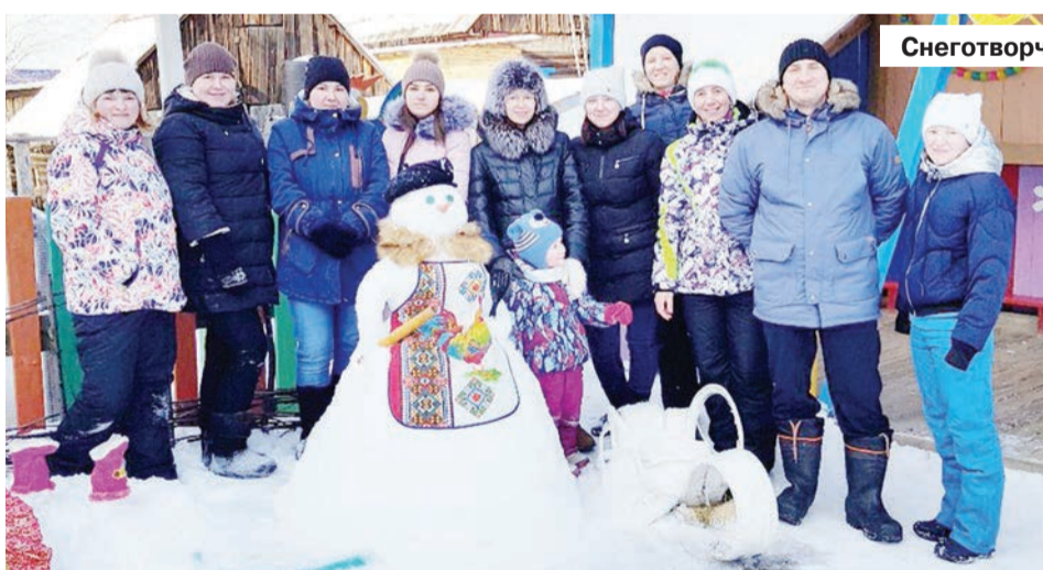
Снеготворчество дошкольного отделения ОУ №21

Избрана депутатом Думы Березовского городского округа в октябре 2016 года.