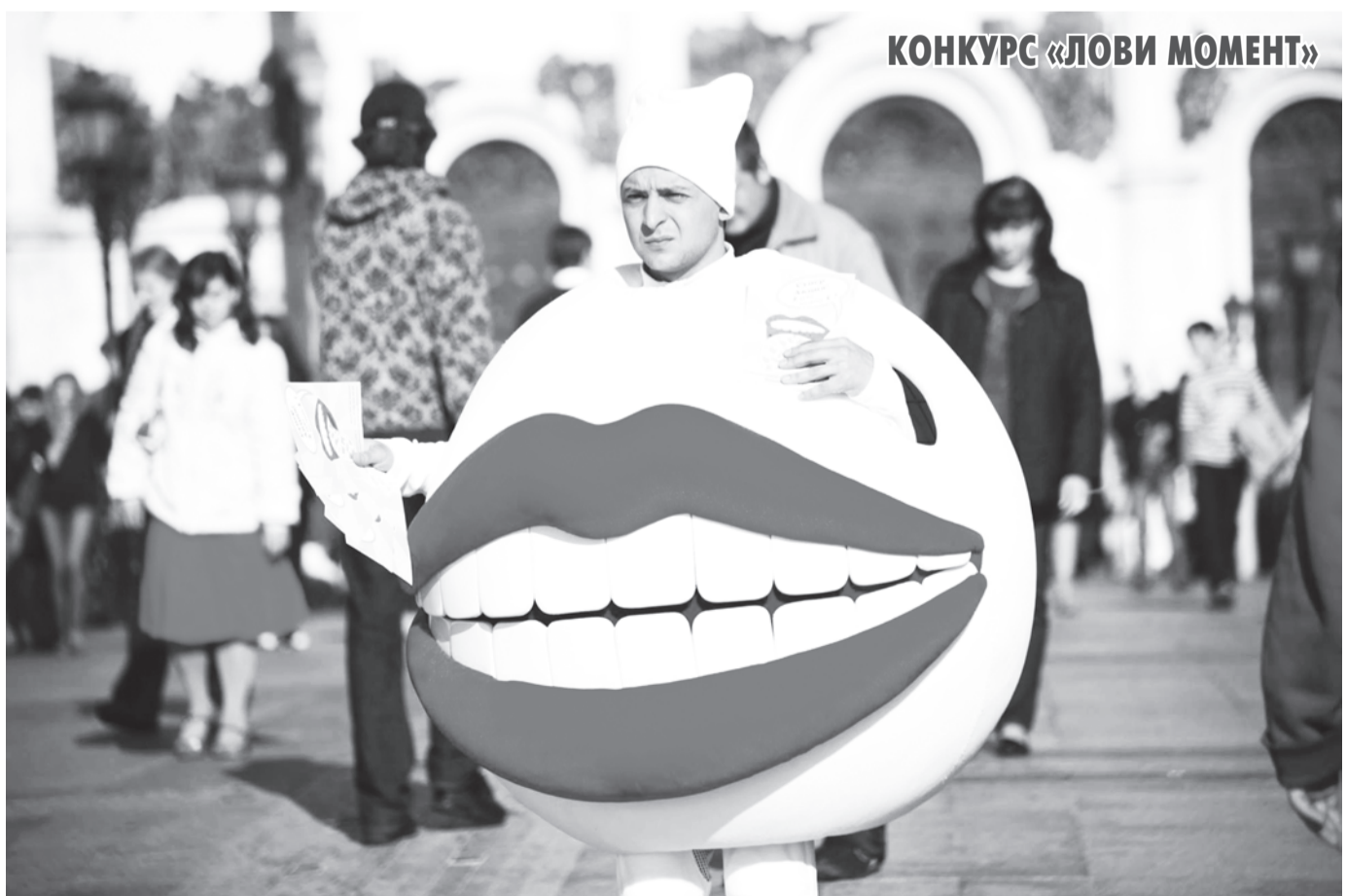
КОНКУРС «ЛОВИ МОМЕНТ»

Сканворды, кроссворды, головоломки на заказ и бесплатно - www.scancross.ru