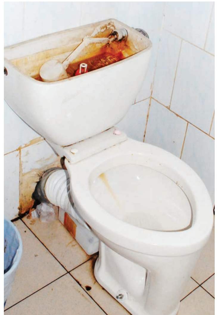
Этот унитаз в одном из санузлов Берёзовской ЦГБ может стать главным героем программы «Ревизорро. Медицинно»