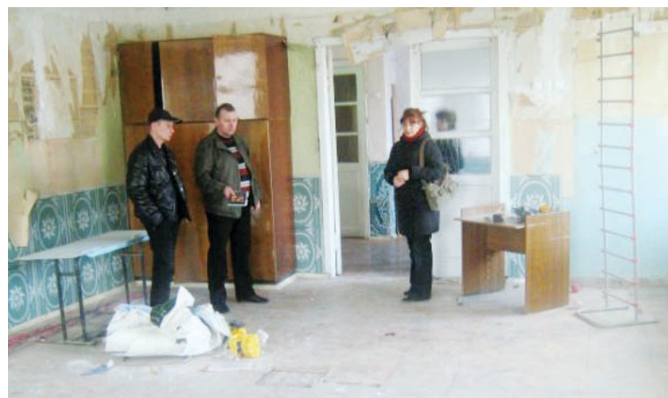
Так сейчас выглядит спортзал, предназначенный после ремонта детям с дефектами речи