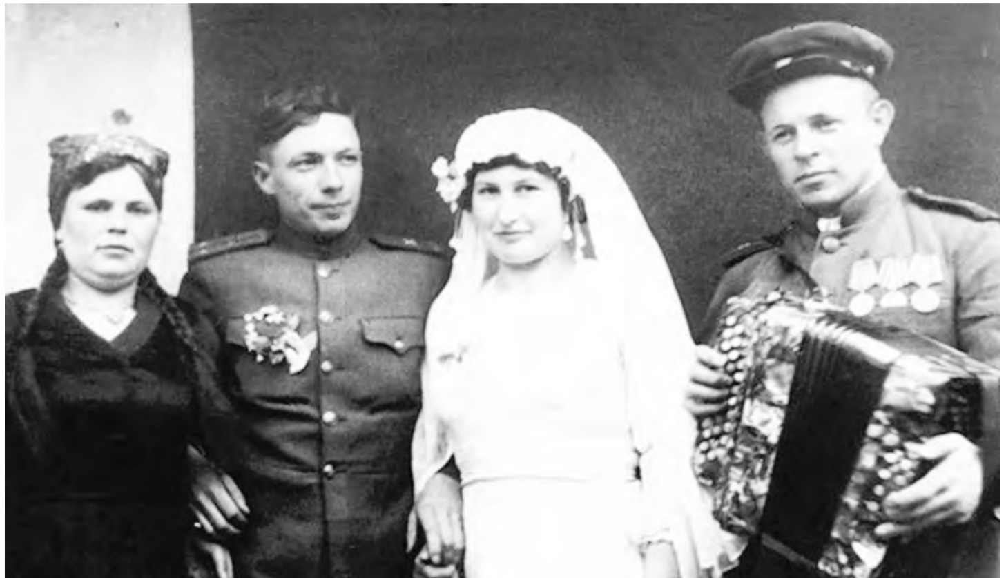
На фото: первые послевоенные свадьбы.

На желтые, почти коричневые листы книги актовых записей 1918 года легли написанные тонким чернильным пером с витиеватыми «ятями» строчки. Им почти сто лет. Дух захватывает не только от вида раритетного документа, но и любопытной информации, которую, если не спеша вчитываться, можно собрать из редких имен наших прабабушек и массовых профессий в Берёзовском заводе, улиц, еще не сменивших свои старые, очаровательные названия по воле большевиков на их же собственные фамилии.