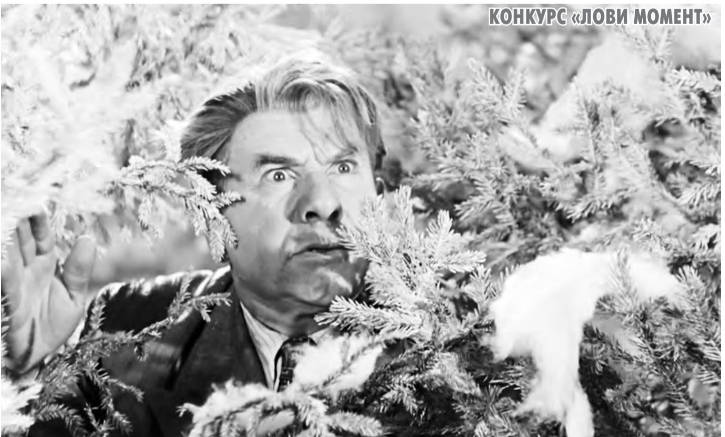
КОНКУРС «ЛОВИ МОМЕНТ»