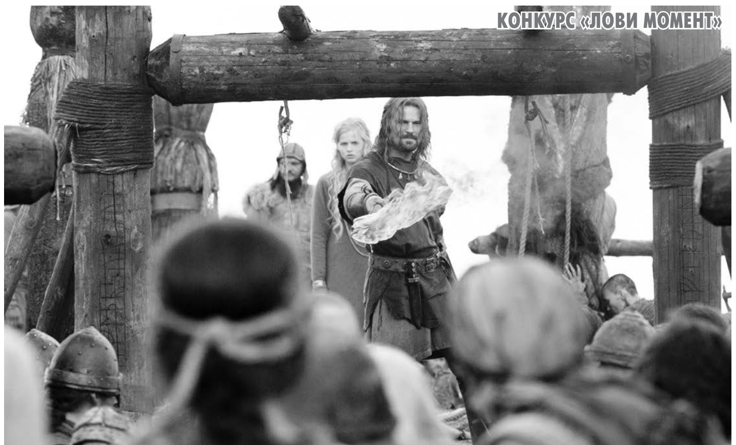
КОНКУРС «ЛОВИ МОМЕНТ»