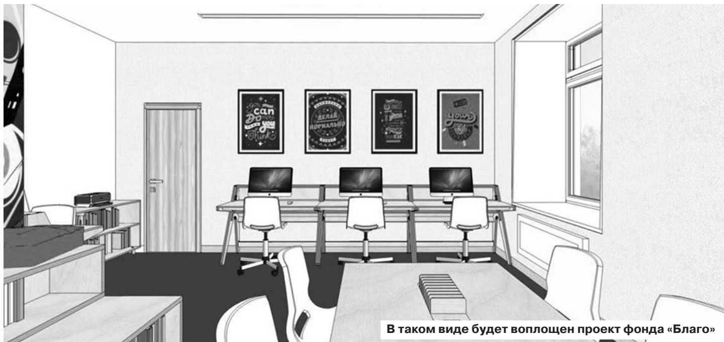
В таком виде будет воплощен проект фонда «Благо»

22 ноября координационный комитет по проведению конкурсов на предоставление грантов Президента РФ на развитие гражданского общества подвел итоги второго конкурса и конкурсной кампании 2017 года. Всего было представлено 9543 проекта из всех 85 регионов страны. Победителями стали 2243 некоммерческие организации, из них 66 из Свердловской области, три – из Берёзовского! Это региональная общественная организация развития семьи «Будущее в детях», музей «Русское золото» и благотворительный фонд «Благо».