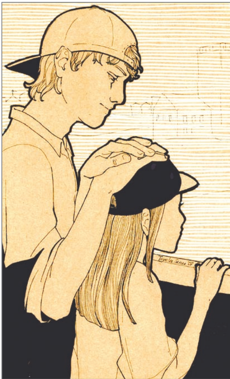
А старшие разберутся сами