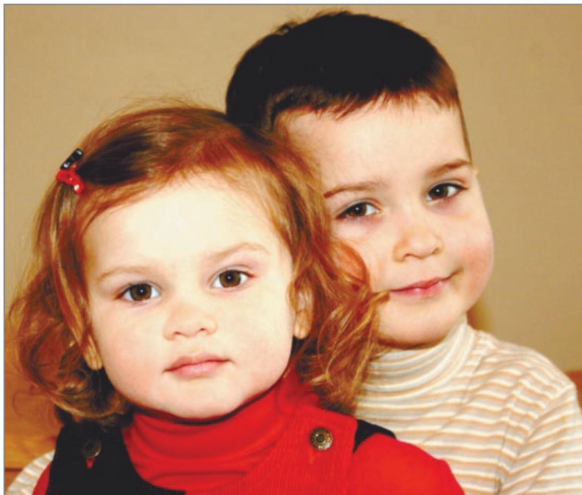
Малышам нужно помочь установить отношения

го либо последующего) ребенка очень важным моментом является психологическая подготовка старших к рождению младшего. До его появления нужно обязательно рассказать о том, что у первенца скоро появится братик или сестричка, дать потрогать мамин живот. Желательно, чтобы родители объяснили, каким будет этот младенец, каким образом изменится поведение домочадцев после его появления. Говорить, что ничего не изменится и все будет по-прежнему, и мы будем любить тебя так, как раньше, – нельзя. Ведь все понимают, что изменится, еще как изменится! Поэтому допустимая формулировка такова: очень многое в нашей семье поменяется, но мы будем любить тебя так же. Это поможет ребенку легче подготовиться к новой внутрисемейной ситуации.