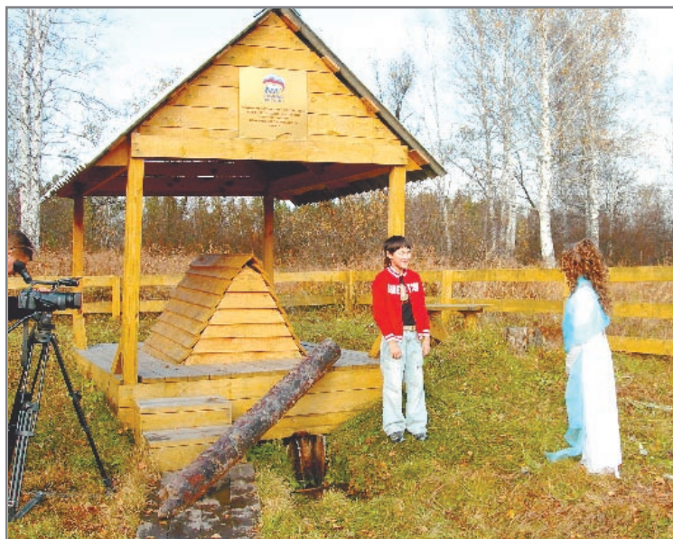
Родник «Крутиковский» популярен у березовчан и гостей нашего города

Сначала ключом пользовались только Крутиковы, а после стали брать воду из него жители поселка, причем не только близлежащей улицы Ленина, но и соседних, а также грибники, ягодники, охотники, туристы. Назвали источник «Сероводородный-2», так как вода его с сероводородным запахом. Нетрудно предположить, что народ считает ее лечебной. Не так давно ребята из экологического отряда школы №30 на своем собрании решили переименовать родник в «Крутиковский», по сути, «вернуть» старому солдату его ключ. Жители Сарапулки поддержали идею. Более того, помогли восстановить источник, обустроить территорию. Ос-