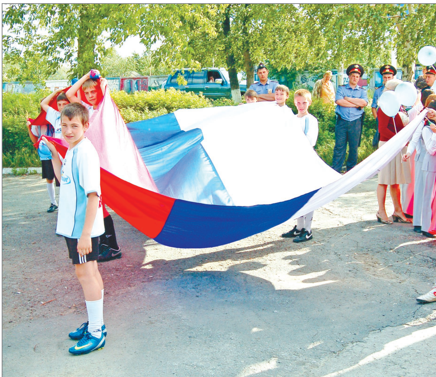
Будущее России – в руках молодых