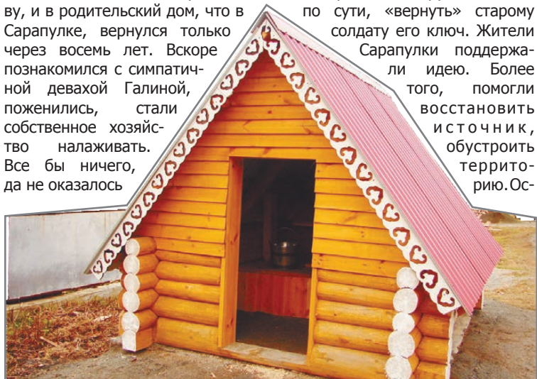
Обновленный колодец на улице Новой в Старопышминске