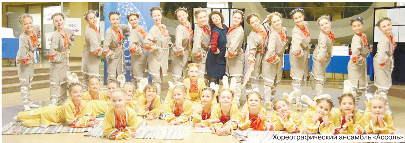
Хореографический ансамбль «Ассоль»