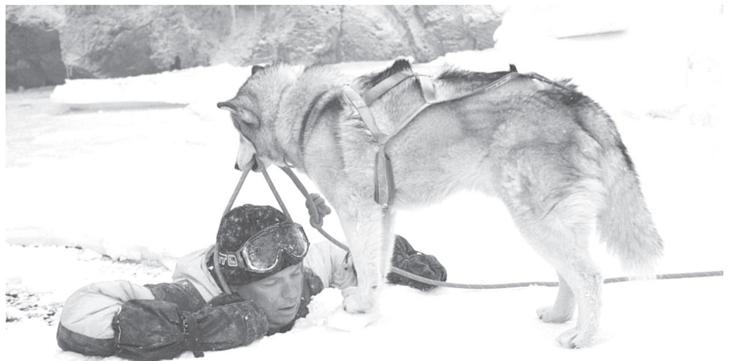
КОНКУРС «ЛОВИ МОМЕНТ»