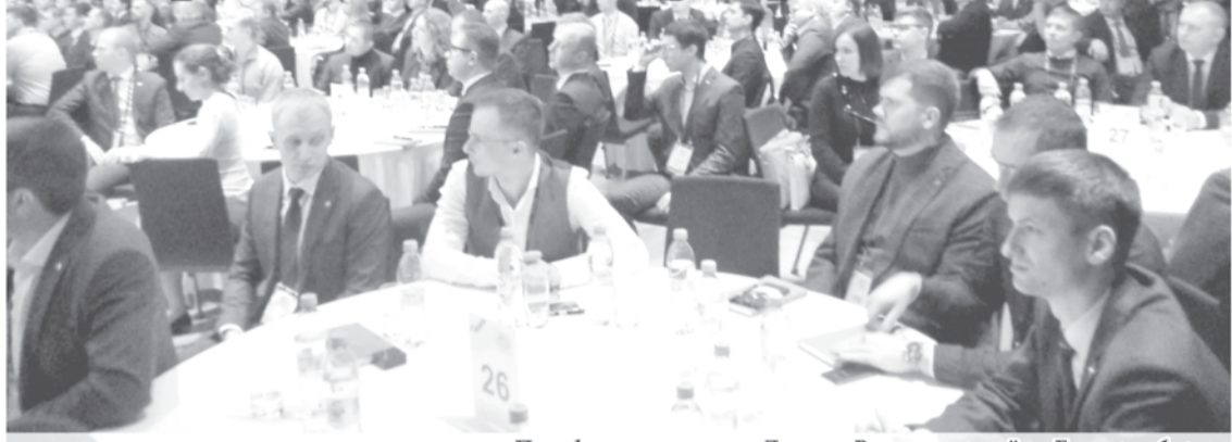
Полуфинал конкурса «Лидеры России» прошёл в Екатеринбурге

Глава региона Евгений Куйвашев поручил областному правительству в работе с кадрами ориентироваться на итоги Всероссийского управленческого конкурса «Лидеры России». Полуфинал этого конкурса для представителей регионов УрФО состоялся в Екатеринбурге 4 декабря.