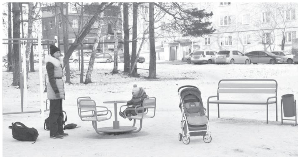
Большой двор – большие проблемы

– С одной стороны, все хотят жить в благоустроенном дворе, где весело играть детям и безопасно гулять мамочкам с колясками, маломобильным пенсионерам. И в то же время никто не хочет тратить на свой комфорт, все ждут, что за них решат другие, например, муниципалитет на бюджетные деньги обустроит, починит и почистит. Увы, об этом надо забыть: та же программа «Тысяча дворов» канула в Лету. Надеюсь, что жители этого двора поменяют свою позицию на конструктивную, их инертность сменится инициативой, и тогда они увидят комплексно обустроенную территорию.