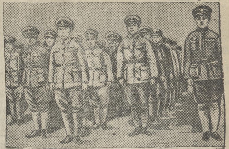
На снимке: Китайские женщины — добровольцы проходят военное обучение перед отправкой на фронт.