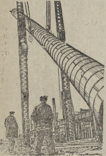
На снимке: Момент подъема семидесятиметровой трубы печи. Рис. с фото В. Георгиева („Прессклише“—Союзфото).

На Магнитогорском металлургическом комбинате имени Сталина производится монтаж металлических конструкций мартеновских печей нового мартеновского цеха № 2. Новые печи войдут в эксплуатацию в 3-м квартале текущего года.