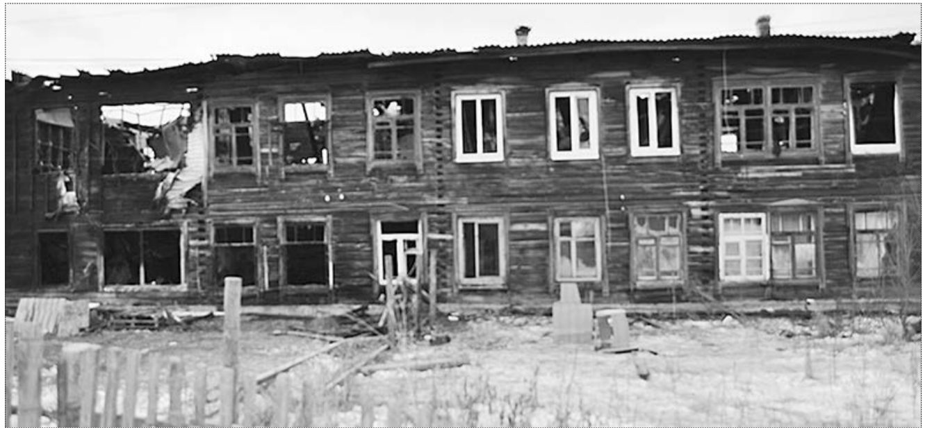
То, что осталось от дома №19 на ул. Комсомольской в п. Монетном