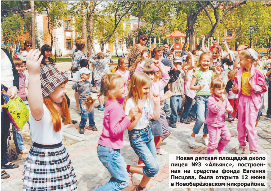
Новая детская площадка около лицея №3 «Альянс», построенная на средства фонда Евгения Писцова, была открыта 12 июня в Новоберёзовском микрорайоне.