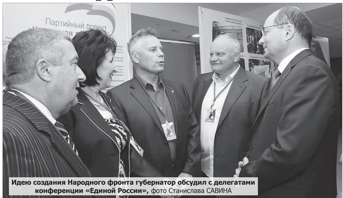
Идею создания Народного фронта губернатор обсудил с делегатами конференции «Единой России»

В состав фронта уже вошли более 450 общественных организаций. В Свердловской области, в частности, о сотрудничестве с ОНФ объявили региональные отделения «Союза машиностроителей России», Ассоциации крестьянских