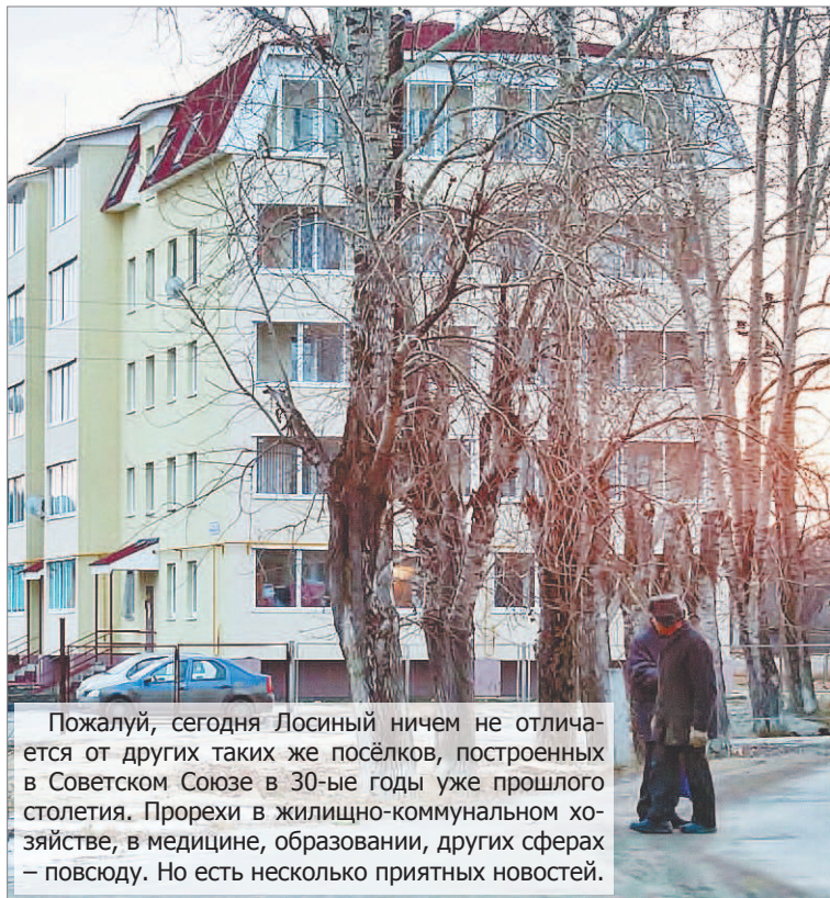
Пожалуй, сегодня Лосиный ничем не отличается от других таких же посёлков, построенных в Советском Союзе в 30-ые годы уже прошлого столетия. Прорехи в жилищно-коммунальном хозяйстве, в медицине, образовании, других сферах – повсюду. Но есть несколько приятных новостей.