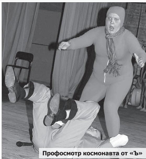
Профосмотр космонавта от «Ъ»

Бездействующий чемпион прошлого года, команда «BazaRU.NET», не смог повторить свой триумф на бис. Нынче градус смешного ребята понизили, но как всегда представили весьма качественный КВН с продуманным сюжетом и единой идеей.