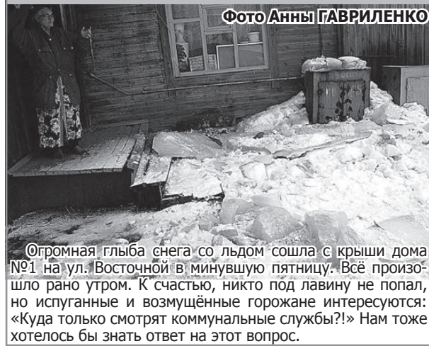
Огромная глыба снега со льдом сошла с крыши дома №1 на ул. Восточной в минувшую пятницу. Всё произошло рано утром. К счастью, никто под лавину не попал, но испуганные и возмущённые горожане интересуются: «Куда только смотрят коммунальные службы?!» Нам тоже хотелось бы знать ответ на этот вопрос.