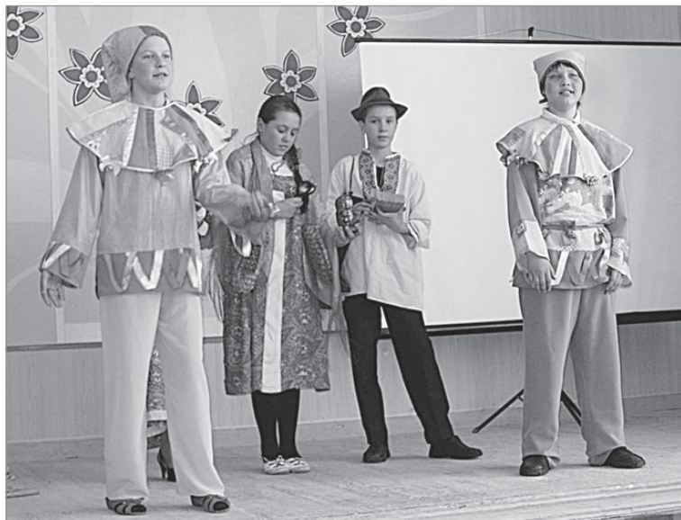
Дети подготовили творческие номера, представляющие татарскую, башкирскую, армянскую и русскую культуры.