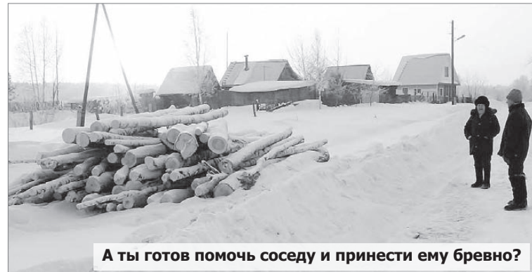
А ты готов помочь соседу и принести ему бревно?

— Новое дело, за которое мы взялись, оказалось сложнее, чем представлялось сначала. В начале декабря снег в Безречном ещё убирался, однако в середине