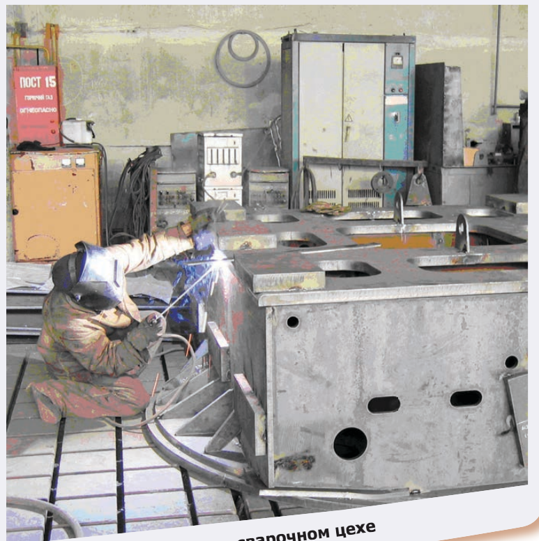
Идет работа в котельно-сварочном цехе