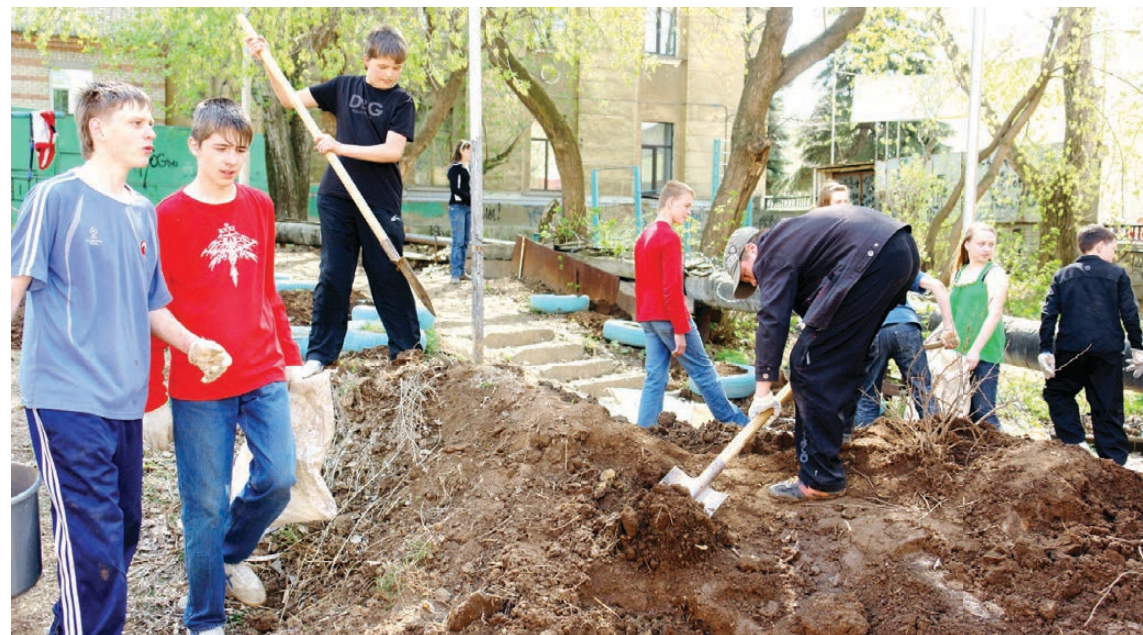
Учащиеся школы № 33 за работой