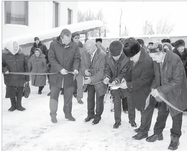
День Ашура для берёзовских мусульман – особый праздник. Именно в День Ашура, 29 января 2007 года, официально открылась наша мечеть на улице Советской. Ленточку перерезали первые лица города, аксакалы, члены попечительского совета мечети.

Известно, что в этот день иудеи Медины держали пост в память о Мусе (а.с.), который вывел их народ из египетского плена. Тогда Пророк (савс) сказал: «Мы имеем больше прав на Мусу (а.с.)» и приказал мусульманам держать пост в день Ашура вместе с предыдущим или последующим днём. Тогда ещё не был ниспослан приказ о посте в месяц Рамадан. Поэтому двухдневный пост в Ашура был первым постом, который держали мусульмане. После ниспослания аятов об обязательном посте в Рамадан двухдневный пост в Ашура остался Сунной, то есть рекомендуемым. Но он совершается точно так же, как и пост в месяц Рамадан.