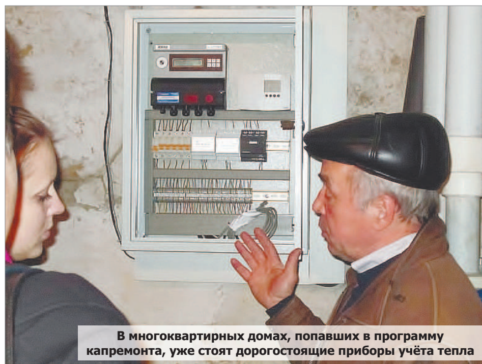
В многоквартирных домах, попавших в программу капремонта, уже стоят дорогостоящие приборы учёта тепла