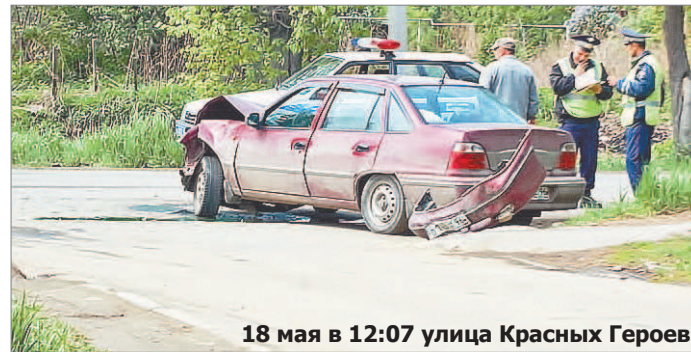
18 мая в 12:07 улица Красных Героев

Новые изменения в правилах коснулись и видеореко-