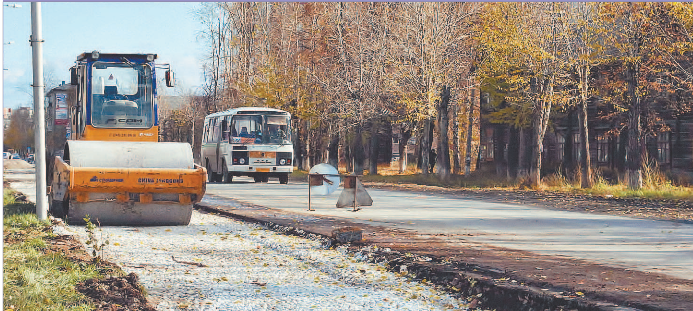
Продолжается расширение проезжей части по улице Театральной, чтобы формировать отдельный ряд для поворота на улицу Строителей. Увеличение ширины на три метра проводится от «Кировского» до перекрёстка.