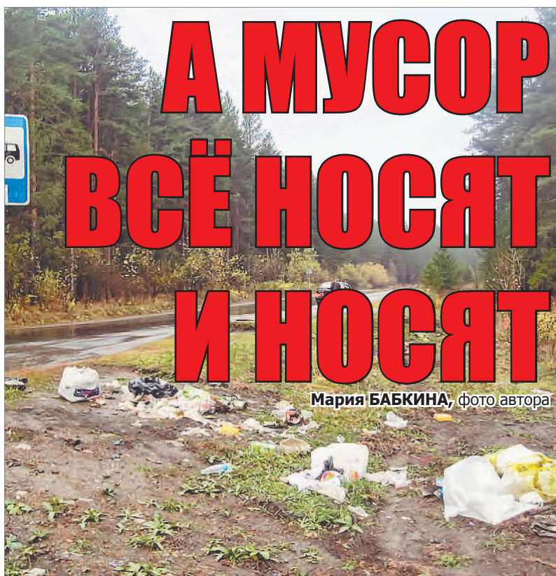
Мария БАБКИНА, фото автора

ЧИТАЙТЕ В СЛЕДУЮЩЕМ НОМЕРЕ: НЕДЕТСКИЕ ПРОБЛЕМЫ ОБЩЕСТВЕННОЙ ПАЛАТЫ