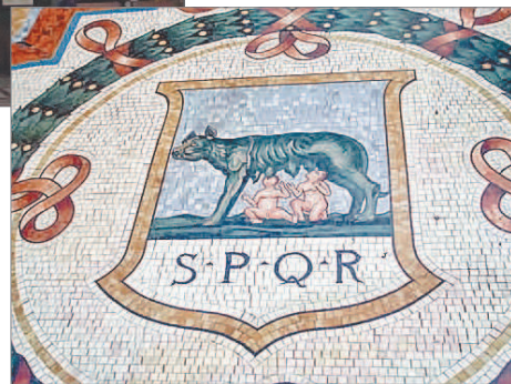
Мозаика на полу галереи

Ранним июльским утром наш путь лежал в картинную галерею Брера, которую правильнее именовать пинакотекой. Несмотря на то, что была суббота, центральные улицы уже заполнили горожане. Как выяснилось, наступил первый день тотальной распродажи в магазинах и бутиках. Очередями нас, советских людей, не удивил, но когда мы оглябли длинный хвост к зеркальным дверям «Шанель», где славный пиджачок от мадемузель Коко стоит со скидкой как по-