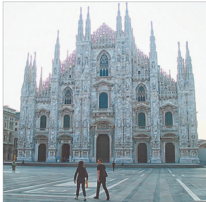
Дуомо в ранний час

Не успели мы обсудить с соседями оригинальные постановки Някрошюса в Большом театре и недавний скандал, случившийся в «Ла Скала», когда артисты, занятые в «Фаусте», в знак протеста против экономии в театре вышли на спектакль не в камзолах и париках, а в джинсах и футболках, как в ложе появился маленький седенький японец в возрасте. Узнав, кто мы и откуда, сразу сообщил, что бывал в