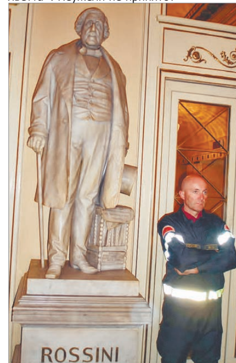
В фойе «Ла Скала»

Логическим завершением первого дня стало посещение церкви Санта Мария делла Граце. Название вам, возможно, ни о чём не говорит, но вы прекрасно знаете то, что