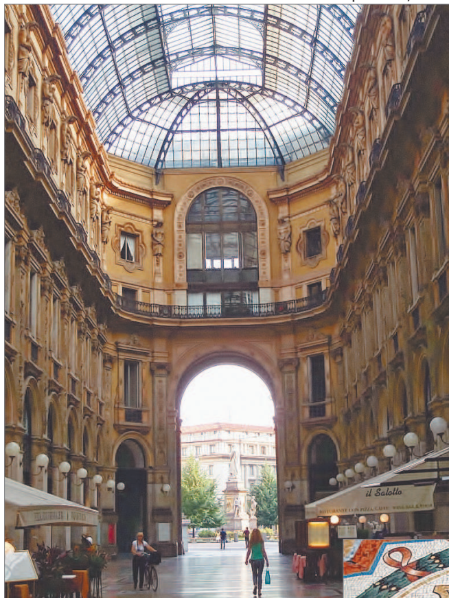
Через галерею Витторио Эмануэля II – к театру «Ла Скала»

Москве и в Вильнюсе, что слушать музыку в «Ла Скала» лучше всего с галёрки, поскольку там самая безукоризненная акустика, и вообще он – профессор оперы и предпочитает оригинальным современным прочтениям либретто классические постановки. Мы тут же притихли от такого знакомства, впрочем, к этому моменту в оркестровой яме уже появился дирижёр, потух свет лампы, а на сцене, заваленной запылёнными книгами, предстал старый доктор Фауст. «Я жизнь отверг и смерти жду с тоскою». Подписав договор с Мефистофелем, он станет цветущим юношей и погубит не только себя, но и юную Маргариту. Искушенная публика (если судить по стоимости билетов, случайные люди сюда не забредут скоротать вечеров) слушает очень тихо и напряжённо. Знаменитые куплеты Мефистофеля «На земле весь род людской» встречает гробовым молчанием, видно, не признавая их за оперный шлягер, зато другие арии приветствует рукоплесканиями. После того, как занавес уже закрылся, артистов долго не отпускают, а вот цветы почему-то не дарят. Так будет и на следующем спектакле – «Ромео и Джульетта». Неужели не принято?