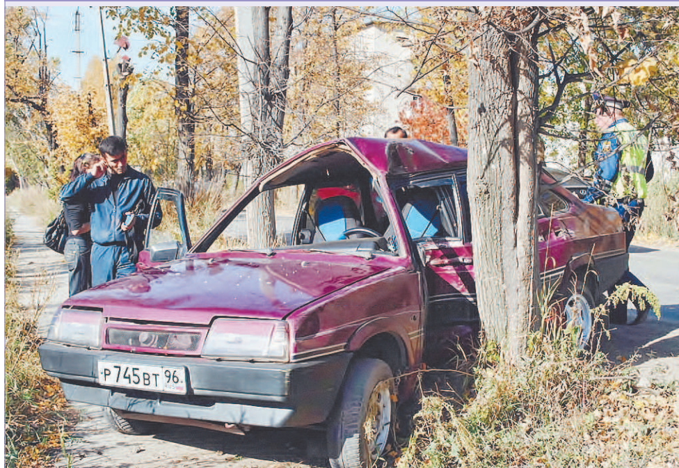
21 сентября 2010 года 16:02 Эта авария — лишь следствие нарушения правил дорожного движения. Но расплата — собственный разбитый автомобиль.