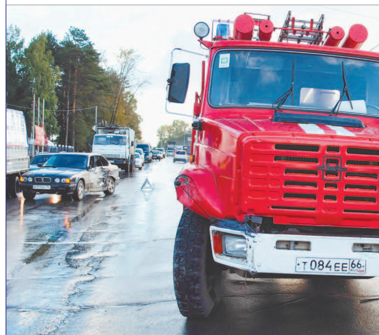
В ДТП, произошедшем на Берёзовском тракте, пострадало 3 автомобиля. Подробности читайте в следующем номере.