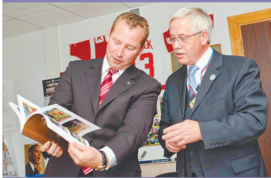
В память о визите гостям подарили книги о Берёзовском