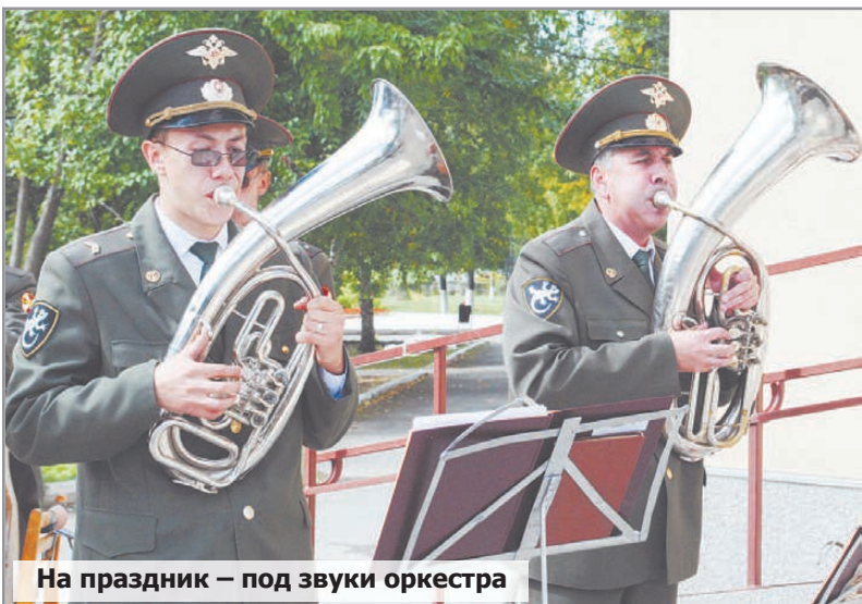
На праздник – под звуки оркестра

Публичные слушания по вопросу о введении в Екатеринбург поста сити-менеджера и отмены прямых выборов мэра назначены на 17 сентября. Накануне такое решение приняла гордума. Впрочем, депутаты уже не скрывают, что результат слушаний носит лишь рекомендательный характер, а принимать окончательное решение будут они сами. Представители общественных организаций считают, что единственная возможность остановить процесс введения сити-менеджера - организация многотысячного митинга.