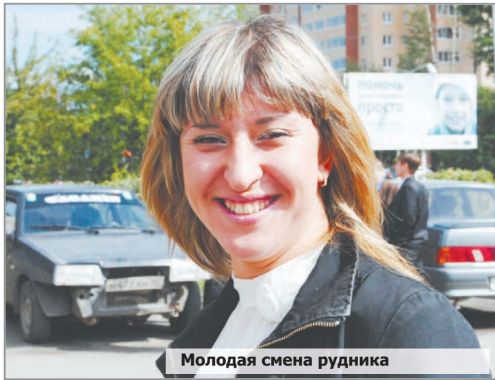
Молодая смена рудника