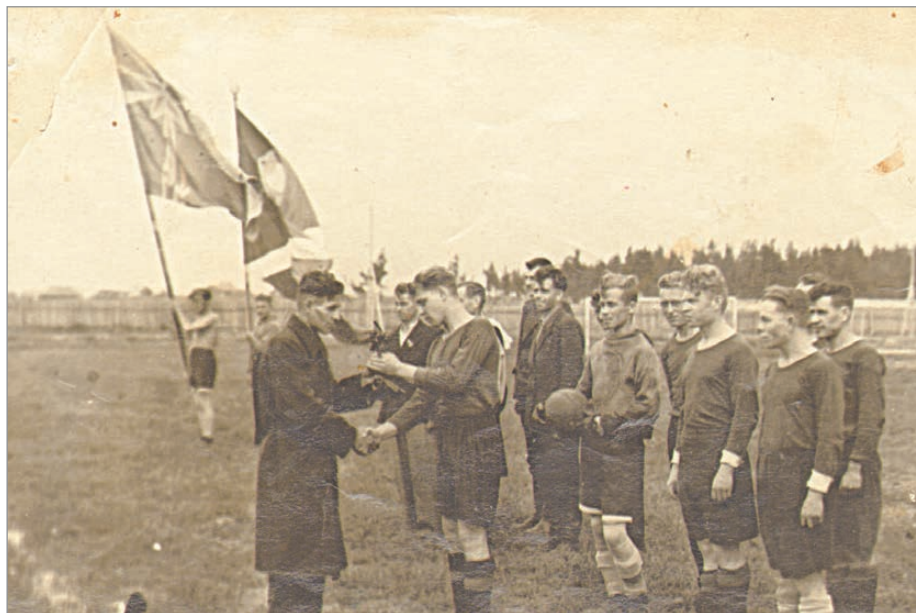
Очередная победа команды «Горняк»