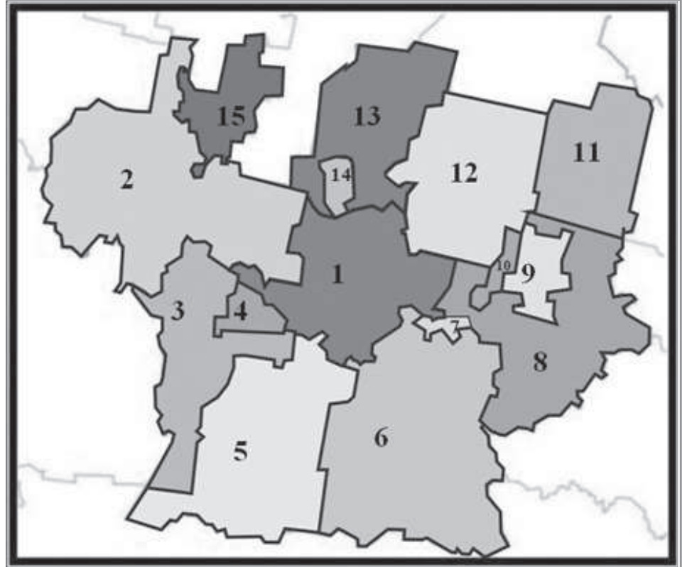
1) Екатеринбург. 2) Городской округ Первоуральск. 3) Городской округ Ревда. 4) Городской округ Дегтярск. 5) Полевской городской округ. 6) Сысертьский городской округ. 7) Арамилский городской округ. 8) Белярский городской округ. 9) Городской округ Заречный. 10) Городской округ Верхнее Дуброво. 11) Асбестовский городской округ. 12) Берёзовский городской округ. 13) Городской округ Верхняя Пышма. 14) Городской округ Среднеуральск. 15) Новоуральский городской округ.

Это непросто, но возможно. В конце концов, мы все цивилизованные люди,