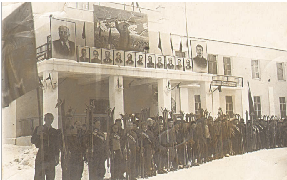
Старт в честь выборов

– Жаль, что не было российской команды, а болел я за хорошую игру!