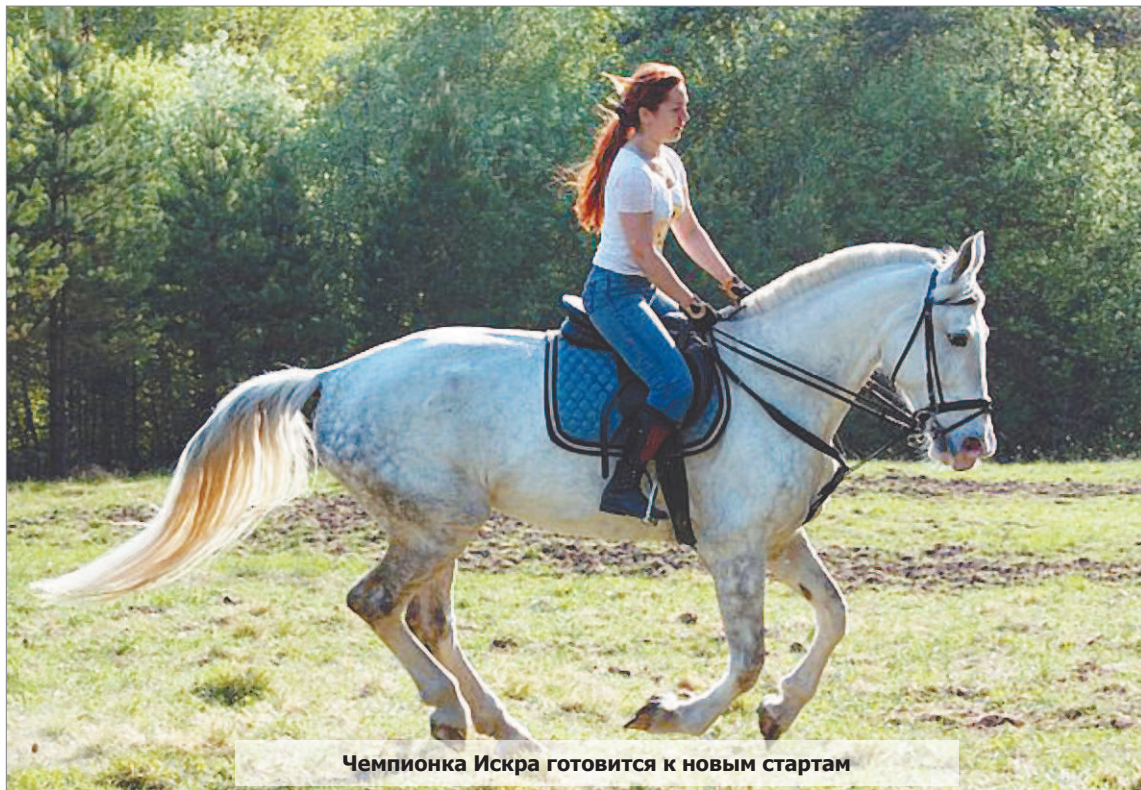
Чемпионка Искра готовится к новым стартам

– Порядка 100-150 тысяч, – отвечает Евгений. – Мне часто задают этот вопрос. И я всегда отвечаю: в Арабских Эмиратах могут полцарства за коня отдать.