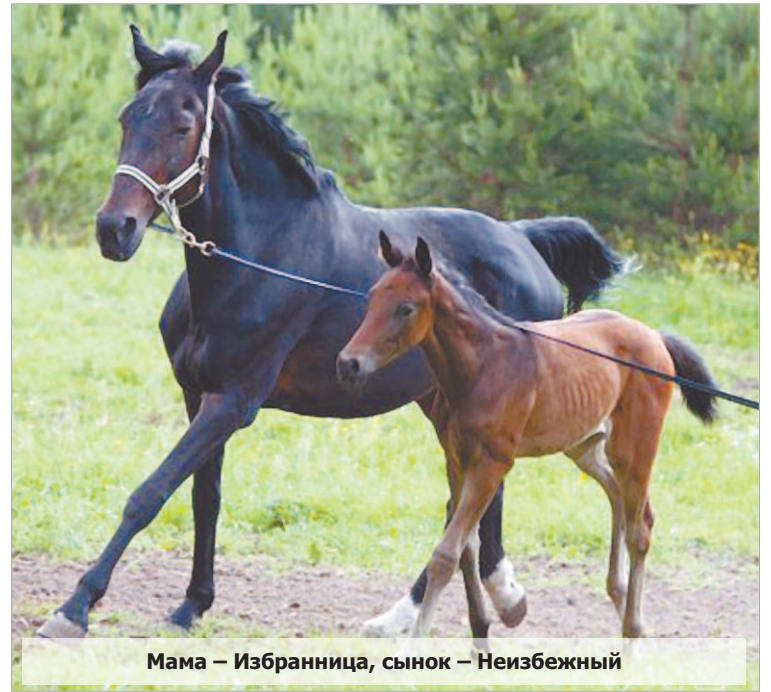
Мама – Избранница, сынок – Неизбежный

– Нет, мы нацелены на тренинг лошадей для всадников высокого уровня. Мы хотим выращивать лошадей, чтобы спортсмены подбериали коня каждый для своего