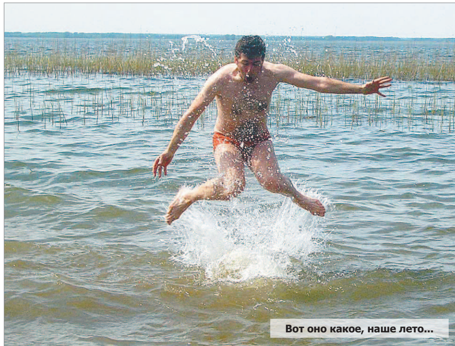
Вот оно какое, наше лето...