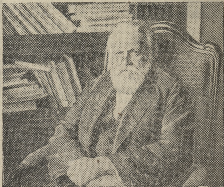
На снимке: Михаил Степанович Ольминский. (1863—1933 г.)

8 мая исполнилось 5 лет со дня смерти старого большевика, публициста и литературного критика Михаила Степановича Ольминского (Александрова).