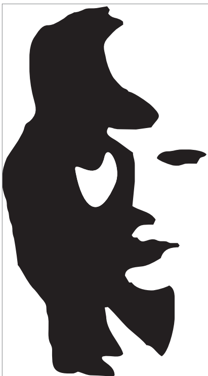
Что ты видишь: музаканта или лицо?

Мальчик на остановке: – Вот видите, дядя, вам нужно было учиться играть на флейте!