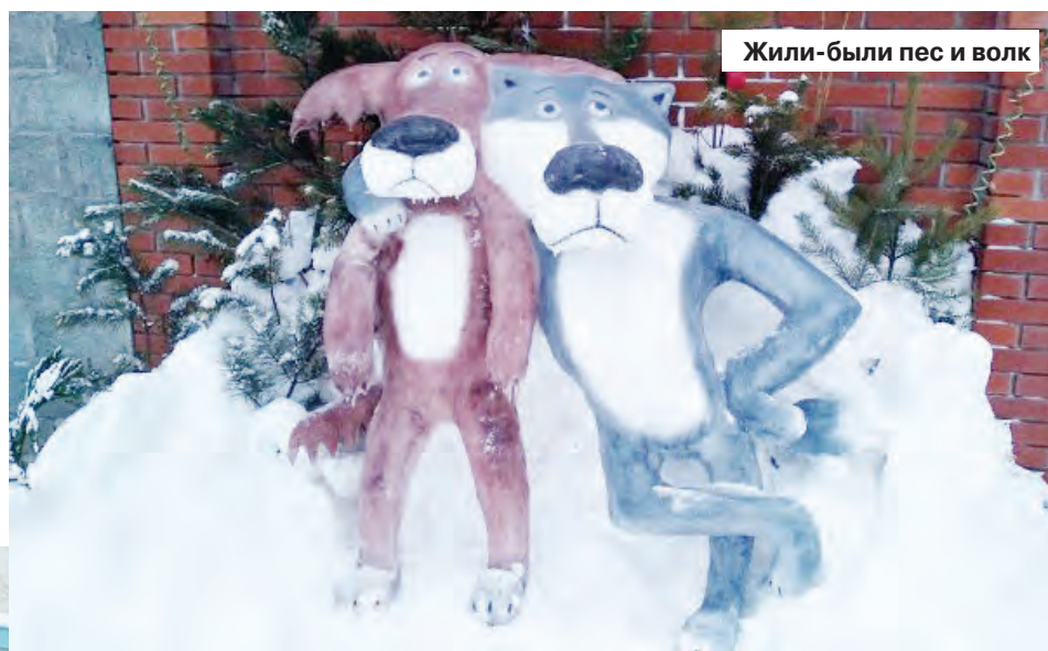
Жили-были пес и волк

Осталась лишь неделя, чтобы стать участником акции: 28 февраля, в день рождения снеговика, состоится праздник с награждением самых креативных и инициативных, а также конкурс на лучшего снеговика. Сбор команд – в 15 часов на площадке перекрестка Театральной и Строителей. Здесь же им предстоит показать свои мастерство и фантазию.