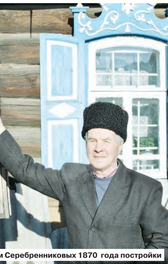
Дом Серебренниковых 1870 года постройки

«Берёзовский рабочий», 29 марта 1963 года