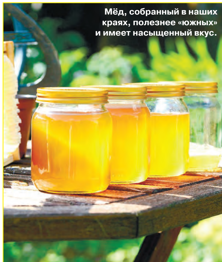
Мёд, собранный в наших краях, полезнее «южных» и имеет насыщенный вкус.

Можно. Но чай должен быть не горячим, в идеале ниже 40 градусов. Под влиянием более высокой температуры разрушаются соединения полезных ферментов и образуется канцероген оксиметилфурфурол. Он не столь страшен, но злоупотреблять им не советую. Тем более при нагреве мёд теряет свои полезные свойства и превращается с сладкий сироп с характерным вкусом.