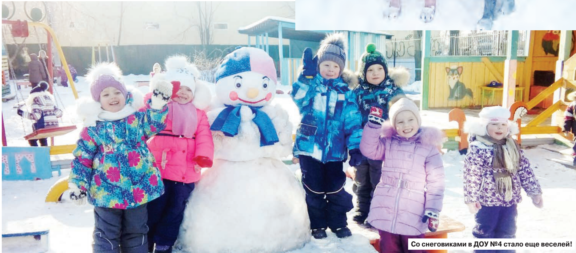
Со снеговиками в ДОУ №4 стало еще веселей!