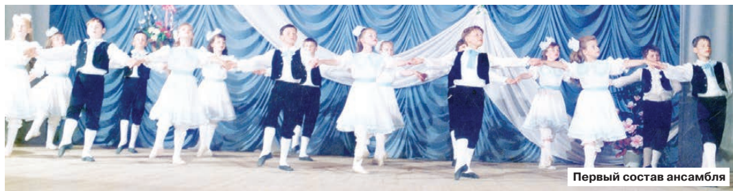
Первый состав ансамбля