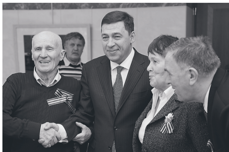
«Всеми своими успехами, своей высокой репутацией, надежной основой и хорошими перспективами будущего роста Свердловская область обязана таким семьям, как ваши. Трудовые династии – это опора Урала, та среда, где закладываются нравственные ценности, семейные, рабочие, патриотические традиции. Наша общая задача – не только сохранить славные традиции действующих трудовых династий, но и создать условия для появления новых», – сказал Евгений Куйвашев.

По семейным летописям и архивам уральских династий можно писать историю становления и развития российской металлургии, машиностроения, энергетики, земледелия, здравоохранения, науки, культуры, спорта. Но чтобы появлялись новые династии, необходимо создавать условия. Об этом губернатор Евгений Куйвашев сказал на очередной встрече с представителями трудовых династий Свердловской области.