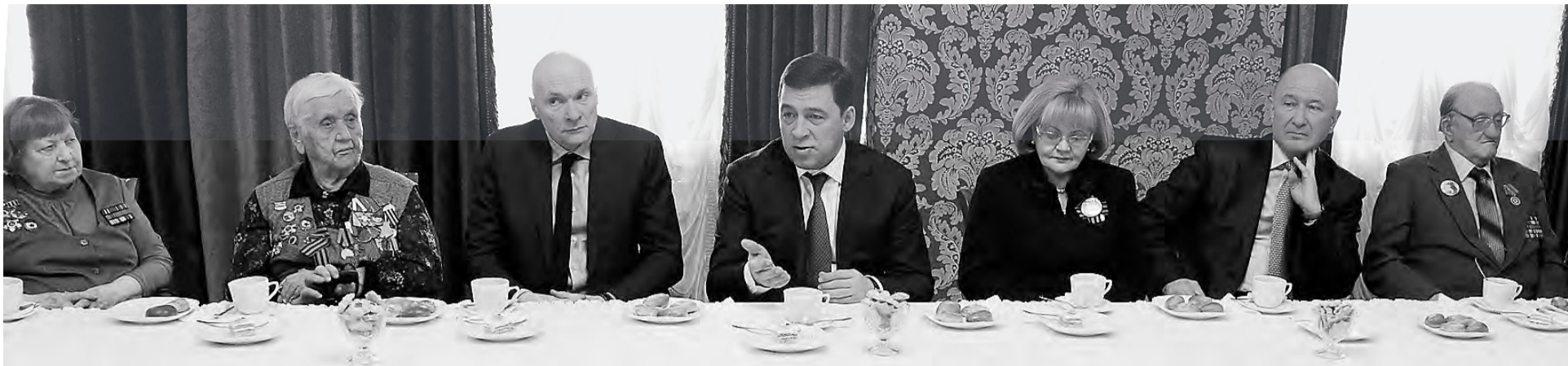
«Формирование Уральского добровольческого танкового корпуса – яркий пример массового трудового героизма. В год 70-летия Победы в Великой Отечественной войне празднование 72-й годовщины создания корпуса имеет особое значение», – подчеркнул Евгений Куйвашев на встрече с ветеранами войны и тружениками тыла, приуроченной ко Дню народного подвига по формированию УДТК. Эта дата в соответствии с Указом губернатора отмечается ежегодно 11 марта.