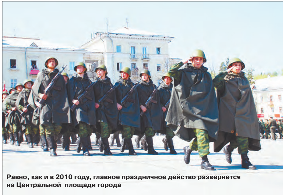
Равно, как и в 2010 году, главное праздничное действие развернется на Центральной площади города

- Мы решили провести торжество, основываясь на опыте пятилетней давности: формат, в котором город отметил 65-летие Победы, понравился многим, мы получили тогда массу положительных откликов. Торжества начнутся 8 мая - по всей стране будет отмечаться День памяти. К Вечному огню возложат цветы коллективы му-