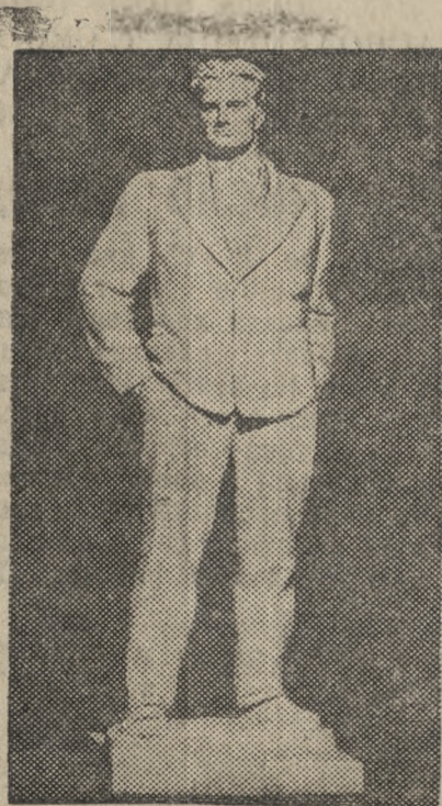
В. В. Маяковский—статуэтка работы скульптора И. М. Чайковского

Маяковский сразу же занял непримиримую позицию по отношению к буржуазному обществу. Его стихи и поэмы 1912—1917 г. г. наполнены великой ненавистью ко всем устоям капиталистического общества—буржуазной морали, собственности, религии, эксплуатации. Когда началась империалистическая война, он поднял против нее свой голос. И тогда же