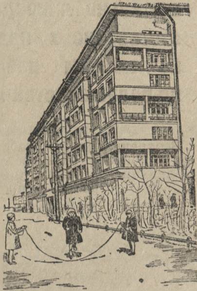
НА СНИМКЕ: Новый жилой дом автозавода имени Сталина по Симоновскому валу в Москве.