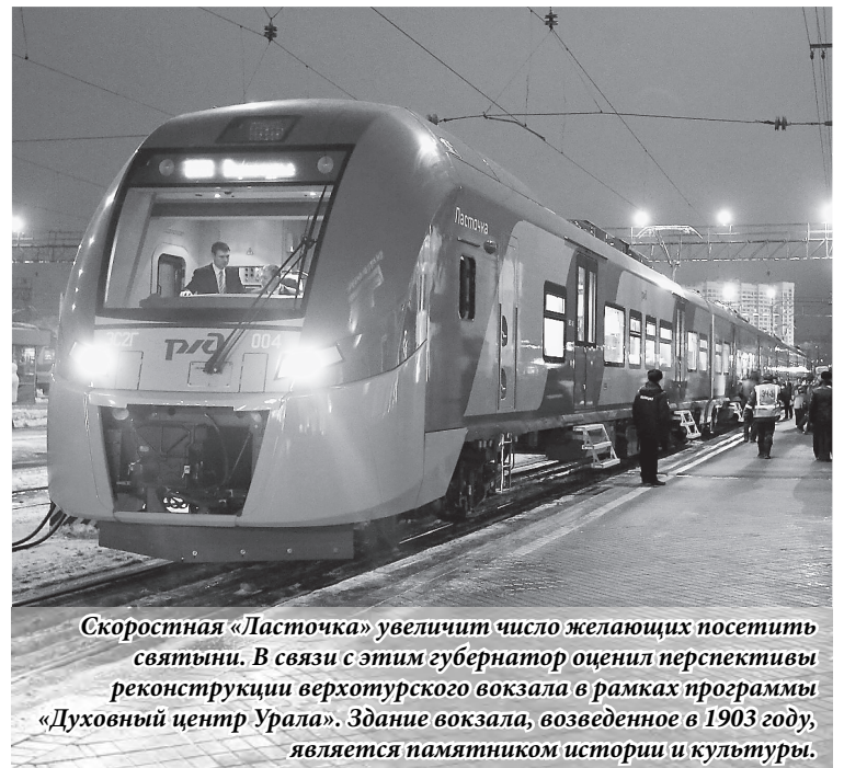
Скоростная «Ласточка» увеличит число желающих посетить святых. В связи с этим губернатор оценил перспективы реконструкции верхотурского вокзала в рамках программы «Духовный центр Урала». Здание вокзала, возведенное в 1903 году, является памятником истории и культуры.

Губернатор Евгений Куйвашев во время крещенской поездки до Верхотурья отметил, что сегодня важно, чтобы жителям северных территорий – Нижнего Тагила, Верхотурья, Новоуральска – было комфортно добираться до Екатеринбурга и обратно. Благодаря новому электропоезду «Ласточка» увеличится пассажиропоток и бизнес-сообщение, будет дан импульс для роста экономики, инфраструктуры и качества жизни.