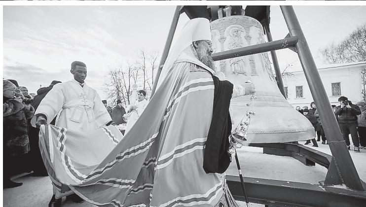
Подготовлено по материалам пресс-службы Законодательного Собрания Свердловской области

Посещение благих мест, таких, как Верхотурье, побуждает на добрые дела, повышает самооценку, даёт силы и здоровье, успех в делах. Это так важно! Коллективная поездка в духовную столицу Урала еще раз показала: нужно творить добро, оно воздастся сторицей.