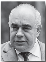
Аркадий Белявский, министр здравоохранения Свердловской области:

«Мы смещаем акцент с оказания медицинской помощи в круглосуточных стационарах на поликлиническую и амбулаторную помощь. В результате всех преобразований: оптимизации сети учреждений, внедрения эффективных контрактов удалось сэкономить 558 миллионов рублей, которые были направлены на повышение заработной платы медицинским работникам».