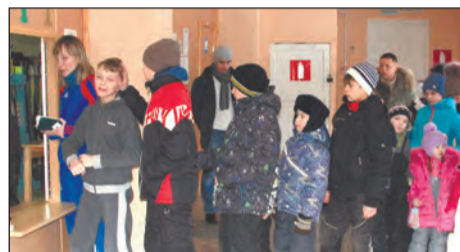
Очередь за получением лыж - теперь явление нередкое на лыжной базе

Еще больше неудобств принесла суровая уральская погода для собравшихся в воскресенье на лыжной базе любителей лыжных прогулок. День открытых дверей привлёк только самых верных, самых преданных лыжному спорту людей. Сильный порывистый ветер не позволил организаторам провести даже «Веселые старты» на свежем воздухе. Пришлось перебраться в помещение, не очень приспособленное для подобных мероприятий. Но, набегавшись и разогревшись, ребята затем все-таки вышли на лыжню. Услугами проката со скидкой воспользовались в этот день более ста человек.