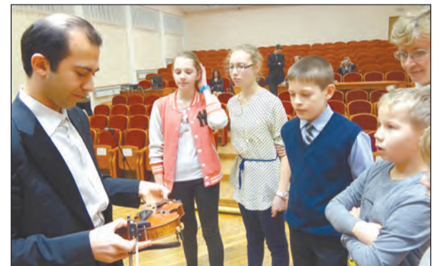
На снимке: ученики ДШИ - самые счастливые зрители: им удалось посмотреть на уникальный инструмент вблизи

Звук инструмента действительно впечатлил: он оказался глубоким и сбалансированным. Порой возникало ощущение, что скрипка буквально разговаривает в руках музыканта (это особенность изделий Страдивари). Зрители с большим вниманием вслушивались в каждую ноту. Знакомые классические произведения раскрылись в совершенно новом качестве. Равнодушных в зале не было!