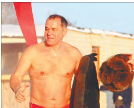
Владимир Машков доволен, получив заряд адреналина