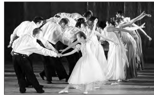
Театр движения «ЛИК»