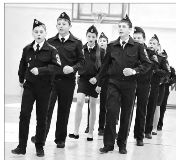
Команда школы № 4 Невьянска на смотре строя и песни

Позавчера, 12 ноября, на семинаре-совещании глав муниципальных образований ГЗУО и руководителей ветеранских организаций округа было запланировано и включено в решение проведение в 2015 году в Новоуральске слёта кадетов Горнозаводского управленческого округа.