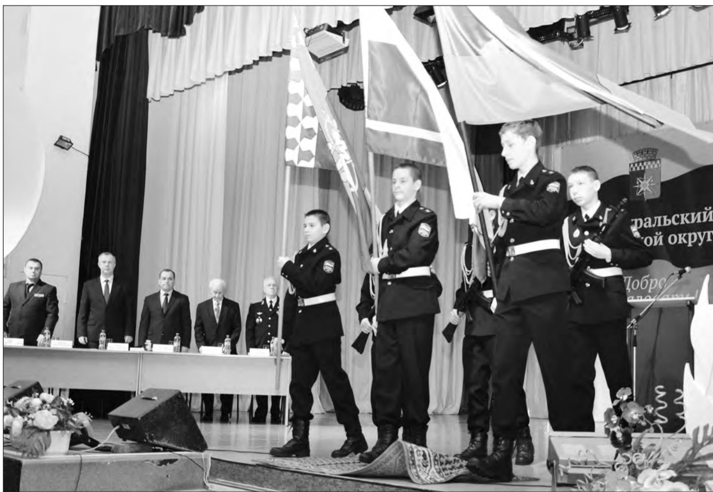
На снимке: вынос знамен кадетами военно-патриотического клуба «Рекрут»

Есть такая традиция и в Новоуральске. Обязательно приеду к вам на фестиваль «Опаленные сердца».