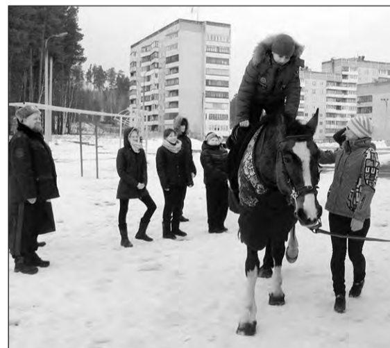
Верховой езде кадетов обучал клуб «Каприоль»