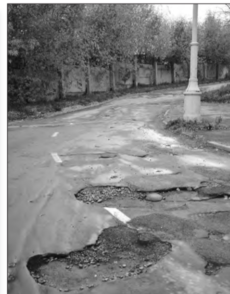
Все лето ждали ремонта дороги жители улицы Горького...

Редакция со своей стороны берется вести поднятую нашими читателями