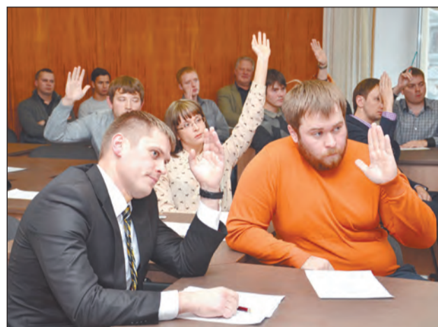
Молодёжная Дума - первое голосование