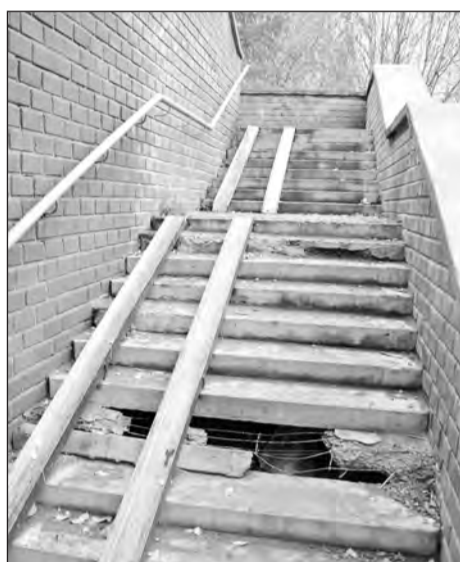
Лестница с улицы Северной к Сбербанку