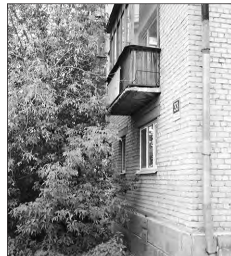
Точно в джунглях дом по ул. Первомайской

тем. Назовем ее условно: «узкие места нашего города». Если вас беспокоит неудовлетворительное состояние благоустройства вашего дома, двора, улицы - звоните в редакцию по телефону: 9-79-28. Адрес для писем: ул. Фрунзе, 7.