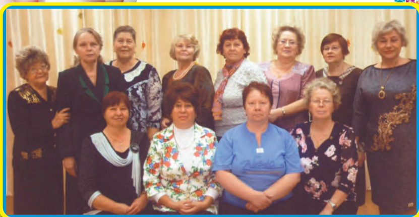
ГРУППА НЕРАБОТАЮЩИХ ПЕНСИОНЕРОВ Д/С №50

В детском саду трудятся люди, Тепло отдавая Наивным, распахнутым Детским сердцам, Детсад прославляя, Науку внедряя, Вперёд продвигаясь К грядущим годам!