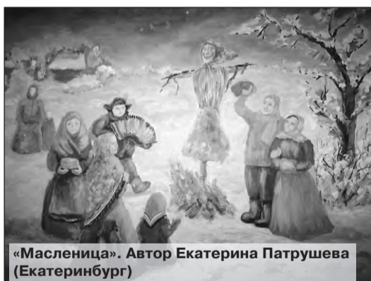
«Масленица». Автор Екатерина Патрушева (Екатеринбург)