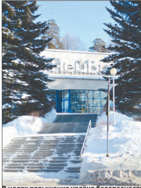
В целях повышения уровня безопасности в Новоуральске в минувшем сезоне, как и было запланировано ещё весной, возле киноцентра «Нейва» демонтирован пешеходный переход. Напомним, что причиной, подтолкнувшей к ликвидации «пешеходника», стала апрельская авария, в которой серьёзно пострадала женщина-пешеход.