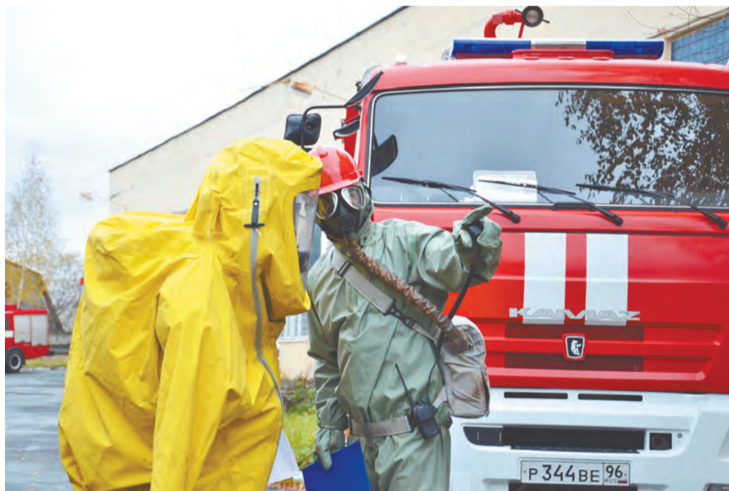
На снимке: авария на молокозаводе привела к утечке аммиака. Согласно этой легенде и действовали совместно силы отряда ГО и ЧС молокозавода и подразделения МЧС (СУ ФПС № 5). Сотрудники МЧС отработывали действия в «фантастических» костюмах повышенной защиты, похожих на скафандры. Кроме того, они задействовали роботизированный комплекс, позволяющий эффективно, без вхождения человека в опасную зону осадить пары аммиака

В условиях чрезвычайной ситуации жили новоуральцы во второй половине прошлой недели - в НГО прошёл целый ряд мероприятий в рамках Всероссийской тренировки по ГО и ЧС