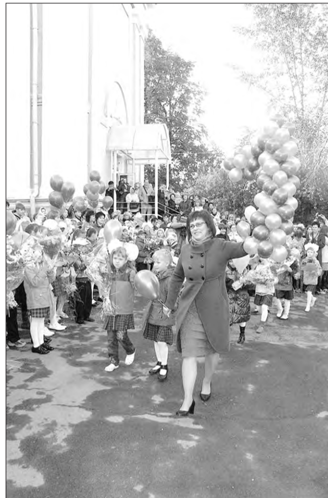
Первый раз - в первый класс. Школа № 43, 2010-й год

В СЕ образовательные учреждения Свердловской области прошли проверку и готовы к началу учебного года. Держать на контроле организацию образовательного процесса главам регионов поручил 27 августа председатель правительства Российской Федерации Дмитрий Медведев на видеоконференции, посвященной готовности к учебному году, в которой принял участие губернатор Евгений Куйвашев.