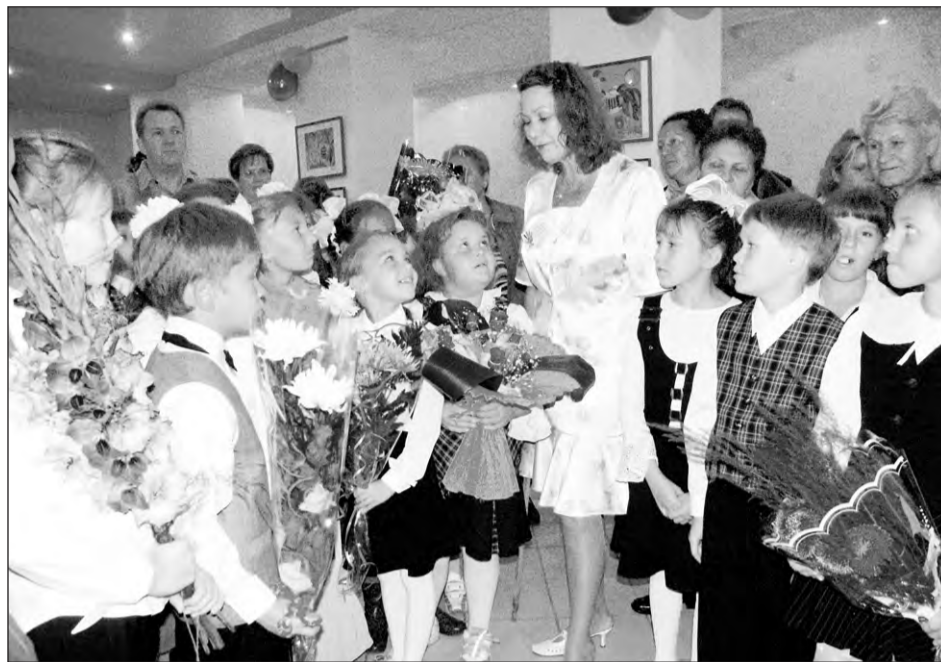
Первое сентября. Школа № 40. 2005-й год

ние у них познавательного интереса, самостоятельности, навыков здорового образа жизни.