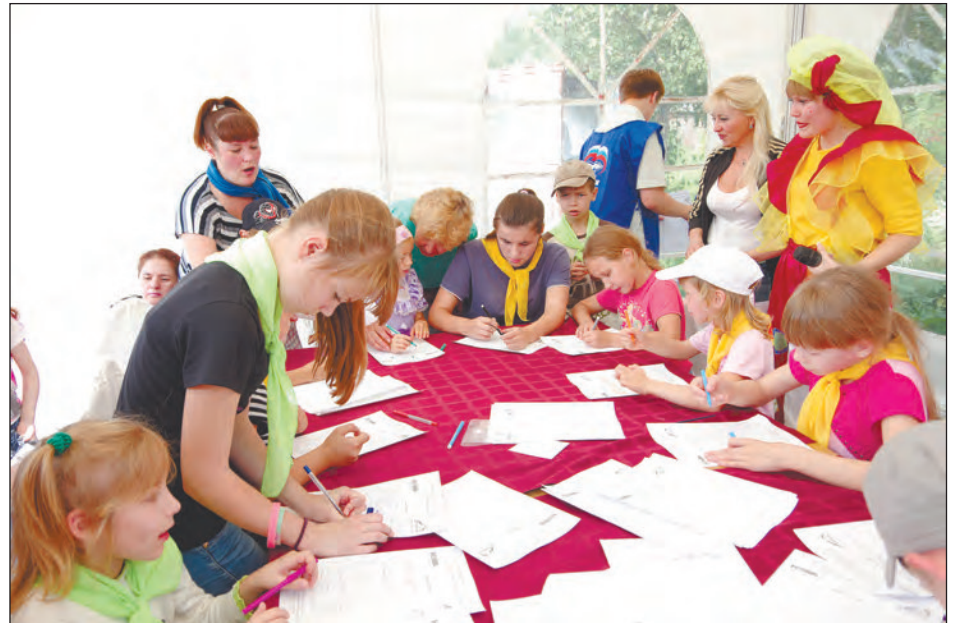
Письма украинским сверстникам пишут новоуральцы

Два с небольшим месяца газета «Нейва» осуществляла сбор школьных принадлежностей. Редакция и ЦПКиО превратились в «канцелярскую фабрику». Но сделали все, чтобы каждая ручка, ранец, тетрадка, купленная вами в дар ребятишкам, дошли до адресатов.