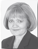
Людмила Бабушкина, председатель Заксобрания Свердловской области:

В течение всего дня на открытых площадках проходили мастер-классы, пешеходные экскурсии по городу, концерты джазовых звёзд Урала и России, зарубежных музыкантов.