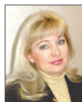
Рубрику ведёт журналист Жанна АПАКШИНА

Кто о чём, а мне сегодня хочется поделиться своими мыслями о качестве обслуживания в новоуральских магазинах. Как говорится, накипело-наболело.