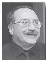
Даниил Крамер, народный артист России:

– В Год культуры в Свердловской области проходит множество знаковых мероприятий. Это и музыкальный фестиваль имени Чайковского в Алапаевске, и музыкальные вечера в дни Ирбитской ярмарки. Фестиваль «URALTERRAJAZZ» повышает привлекательность города Камышлова.