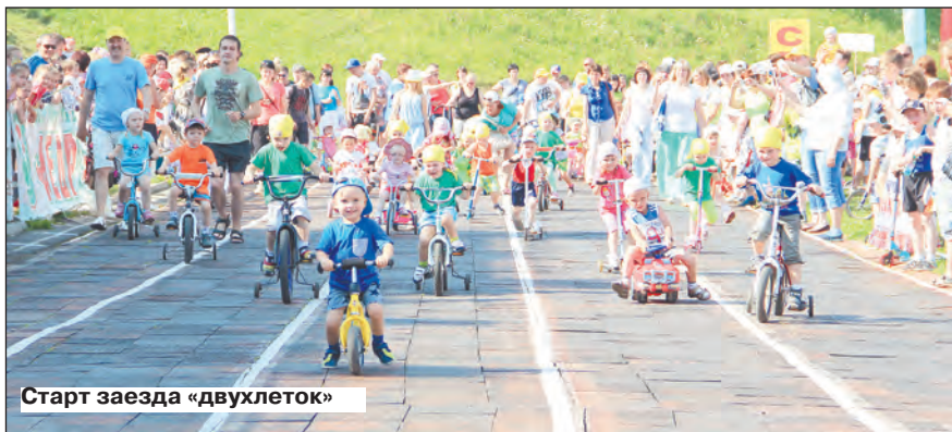
Старт заезда «двухлеток»