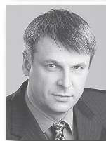
Сергей Носов, глава г. Нижний Тагил:

– Программа переселения граждан в реализации очень сложная, сроки действительно сжатые. Но мы не можем не выполнить наши обязательства перед жителями области, которые сегодня находятся в ненадлежащих жилищных условиях.