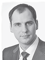
Денис Паслер, председатель правительства Свердловской области:

Учитывая, что в этом году 2397 жителей должны переехать из ветхого и аварийного жилья в новые дома, председатель правительства области Денис Паслер намерен вновь поднять вопрос на одном из ближайших заседаний правительства, считая, что срыва поставленных задач допустить нельзя.