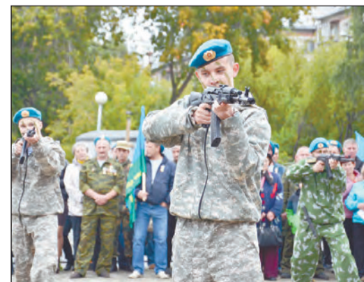
Показательные выступления ребят кадетского класса школы № 48 и военно-патриотического клуба «Крылатая гвардия»