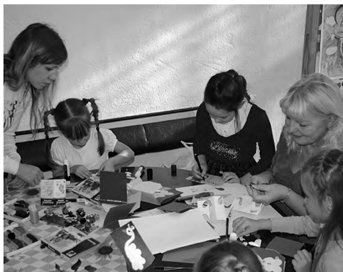
Мастер-класс по изготовлению открыток

В Центре внешкольной работы прошла выставка, приуроченная ко Всемирному дню животных.