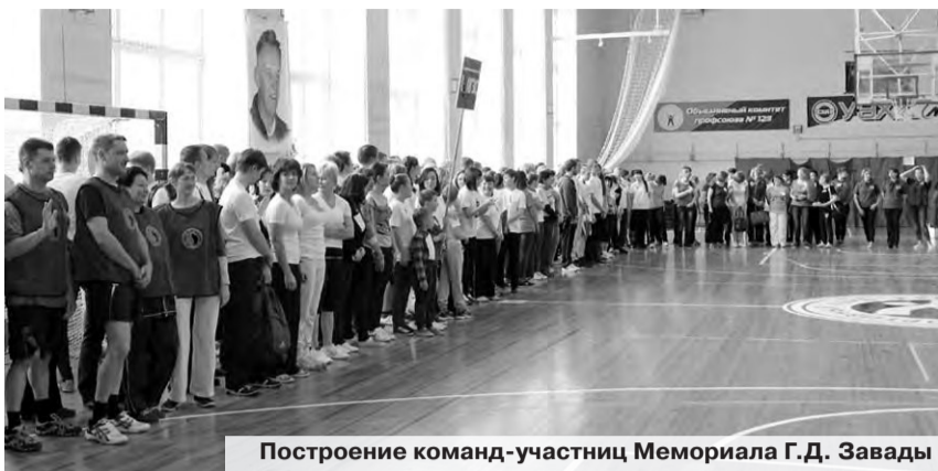
Построение команд-участниц Мемориала Г.Д. Завады