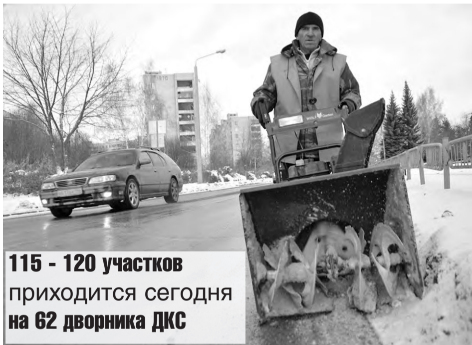
115 - 120 участков приходится сегодня на 62 дворника ДКС