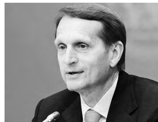
Сергей НАРЫШКИН, председатель Госдумы РФ: