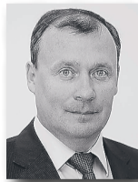
Алексей Орлов, первый заместитель председателя правительства Свердловской области – министр

«Главное – всё, что мы обещаем людям, должно быть исполнено. Пасовать перед временными трудностями мы не будем, у нас достаточно сил, средств, политической воли, чтобы продолжать курс на созидательное развитие региона, достижение нового качества жизни уральцев».