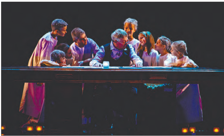
Сцена из спектакля «Сон смешного человека»