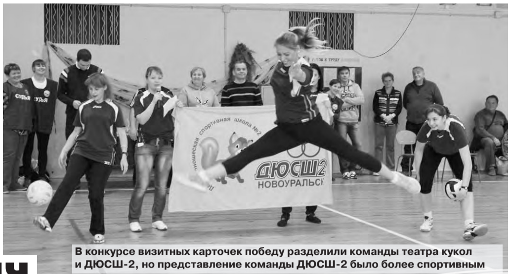
В конкурсе визитных карточек победу разделили команды театра кукол и ДЮСШ-2, но представление команды ДЮСШ-2 было более спортивным

Итоги соревнований, прошедших в минувшую субботу, еще подвоятся и уточняются. По предварительным подсчетам, в тройке призеров среди женщин - команды с/к «Кедр», школы № 40 и «Администрация-1», а среди мужчин - сборная школы с. Тарасково и школы № 49, ДЮСШ-4 и команда школы-интерната № 53.