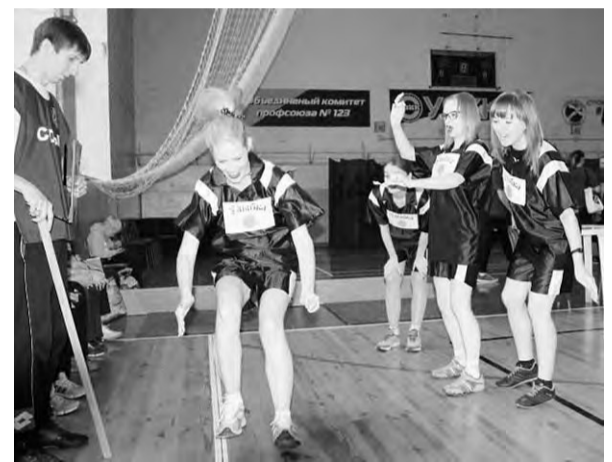
«Гигантский прыжок» команды «Улыбка»