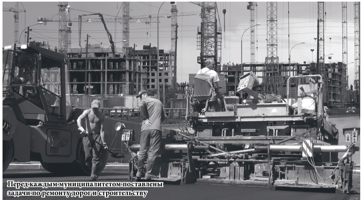
Перед каждым муниципалитетом поставлены задачи по ремонту дорог и строительству