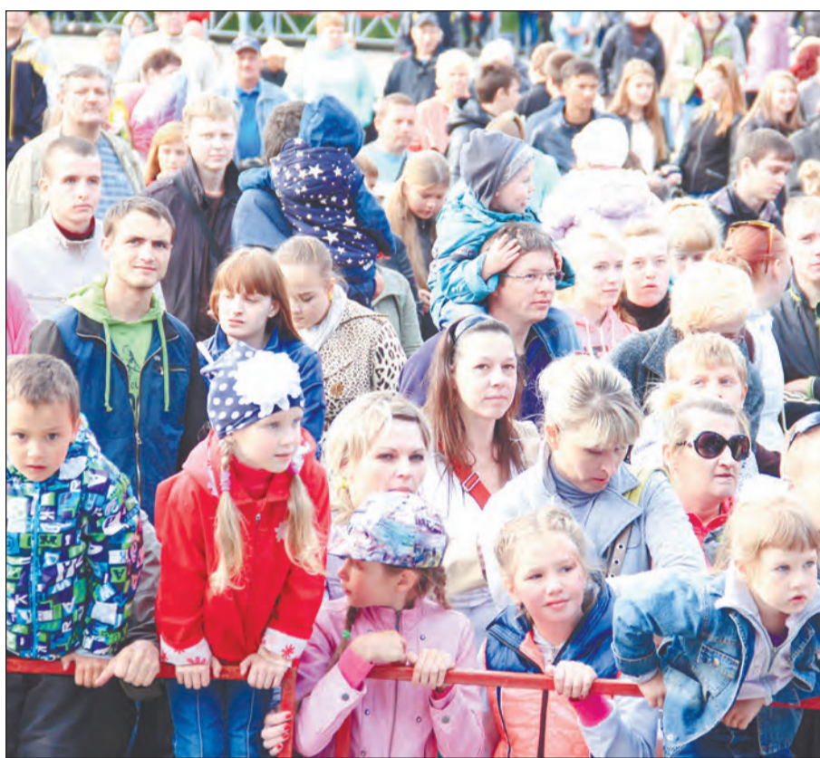
Участники в ожидании главной интриги праздника - розыгрыша призов

На снимках: яркая мозаика праздника труда