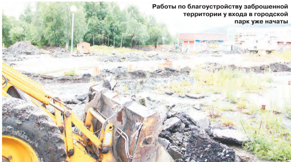
Работы по благоустройству заброшенной территории у входа в городской парк уже начаты