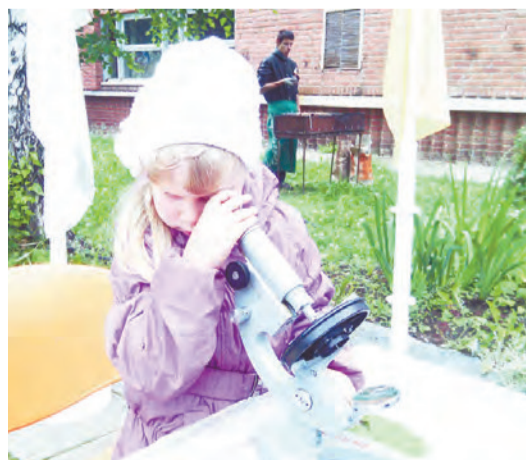
В стране Микроскопии...