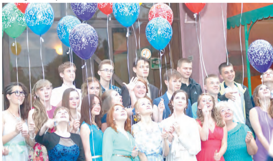
9 «Б» класс гимназии Наш выпускной - он один такой! Мы смотрим вверх, нас ждёт успех!